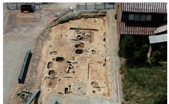
調査区北半近景（B区 東から）