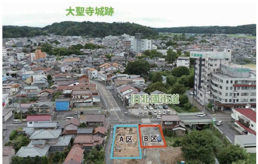
調査区遠景（東から）

小規模な調査ではありますが、今後の整理作業により、当時の城下町の生活の一端が明らかになることが期待されます。