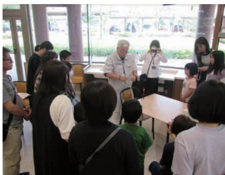
組みひもづくりの説明

令和7年6月8日(日)、県立図書館の食文化体験スペースで『出張！埋蔵文化財センター組みひもづくりワークショップ』を開催し午前午後合わせて20名の参加がありました。指とひもだけを使った「ループ指操作技法」というワザで製作しましたが、単純ですが小指が主役のワザなので慣れないうちは指が意志どおりに動かずにみなさん悪戦苦闘していました。次第に慣れてきたのか色とりどりの組みひもが完成していました。図書館では関連する図書を会場に用意し、興味を持った事柄を詳しく図書で学ぶことができるよう工夫していただきました。まさに図書館で考古学体験をすることの真髄 しんすい といえます。