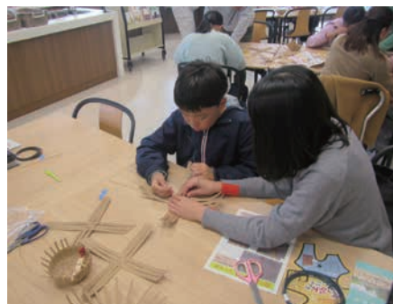
親子で協力してかごづくり

図書館はやはり“知の殿堂”であり、古代体験をきっかけに地域の歴史や考古学に興味を持っていただくには最適の場所だと感じました。今後も県立図書館の協力を得ながら図書館でのワークショップを通じ石川の埋蔵文化財保護行政への理解を得ることに努めたいと思います。