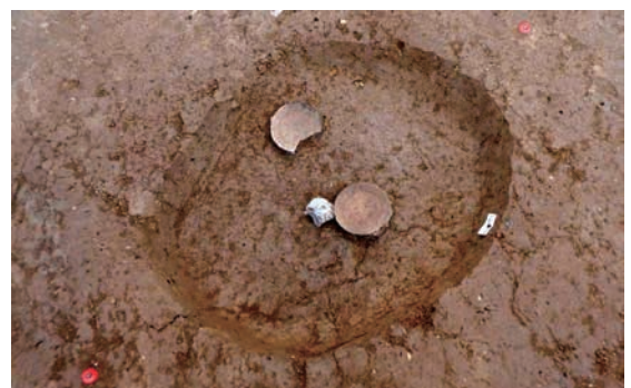
土師器皿出土状況（南から）