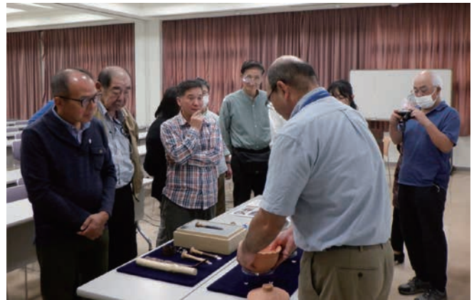
ミニ展示の解説（第2回）

講座の最後には、復元したヤリガンナを使い、実際に木を削るところを見ていただきました。