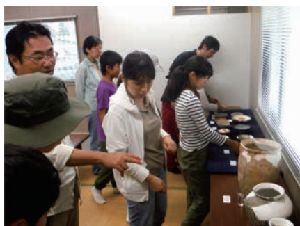
土器の展示と解説の様子