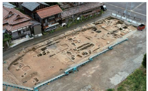
調査区南半近景（A区 北東から）