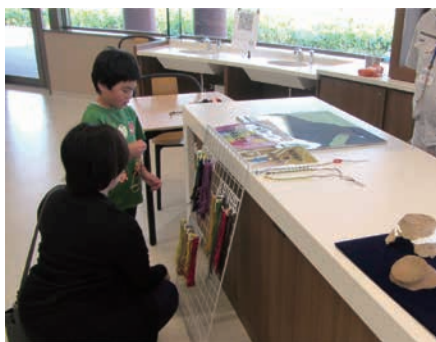
どの色のひもを選ぼうかな