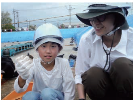
土器が出土しました！