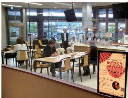
ワークショップ会場

さらに、令和7年11月3日(月祝)には『かごづくり』のワークショップを開催しました。こちらも午前午後合わせて20名の方に参加していただき、紙バンドを材料にしましたが縄文時代にもみられるワザを使ってかごの製作を体験していただきました。『組みひも』もそうですが『かごづくり』も古代のワザが現代でも使われることが多く、我々も図書から知識やヒントを得ています。図書館側が用意してくれた図書にも我々が参考にしたものがあり、その図書を前に解説し実演するのは少し決まりが悪かったのですが、埋蔵文化財センターの強みである本物の資料から得られた知見も解説に組み込み、何とか面目を保つことができました。