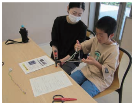
親子で協力して組みひもづくり

さらに、令和7年11月3日(月祝)には『かごづくり』のワークショップを開催しました。こちらも午前午後合わせて20名の方に参加していただき、紙バンドを材料にしましたが縄文時代にもみられるワザを使ってかごの製作を体験していただきました。『組みひも』もそうですが『かごづくり』も古代のワザが現代でも使われることが多く、我々も図書から知識やヒントを得ています。図書館側が用意してくれた図書にも我々が参考にしたものがあり、その図書を前に解説し実演するのは少し決まりが悪かったのですが、埋蔵文化財センターの強みである本物の資料から得られた知見も解説に組み込み、何とか面目を保つことができました。