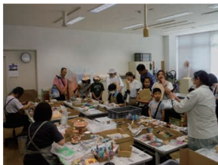
整理作業室の見学