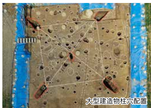
大型建造物柱穴配置