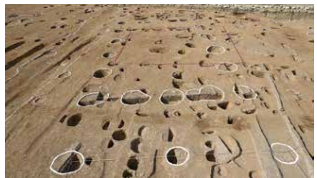
大型掘立柱建物の全景（南から）