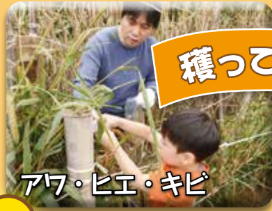
アワ・ヒエ・キビ