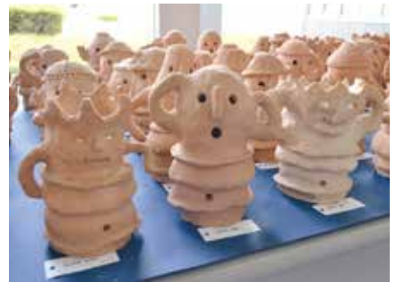
焼きあがった作品