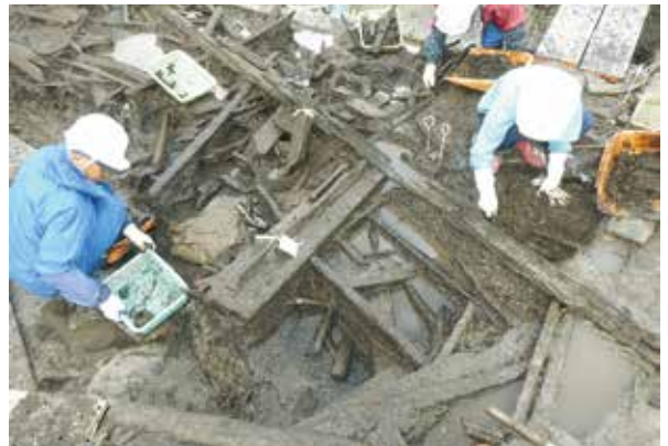
川跡遺物出土作業（西から）