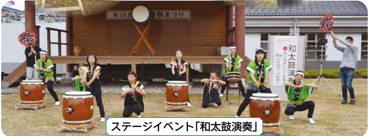
ステージイベント「和太鼓演奏」