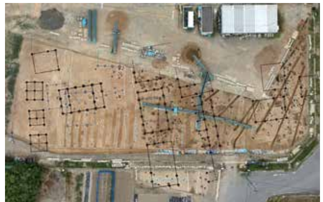
調査区全景と建物配置案（南から）