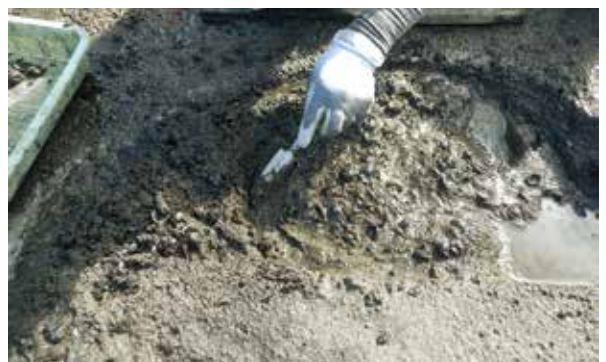
クリ貯蔵穴（弥生時代・南東から）