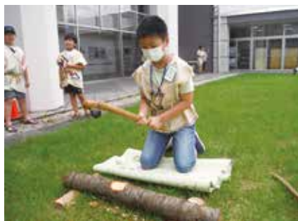
石斧による切断体験