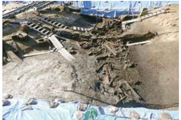
川跡と中州（古墳時代・南東から）