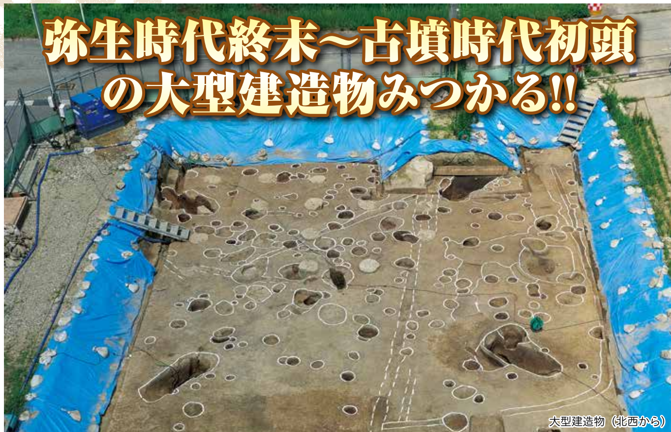
大型建造物（北西から）