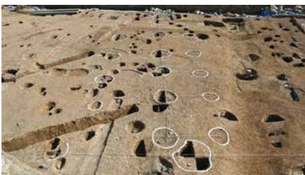
塀跡柱穴列の全景（北から）