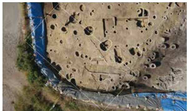
掘立柱建物（平安時代・南東から）