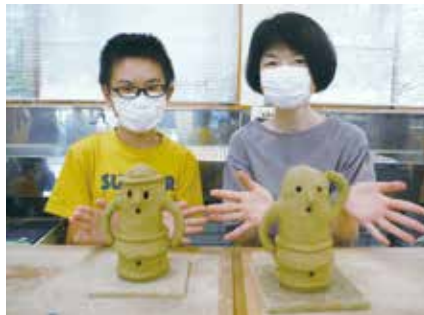
完成した人物はにわ