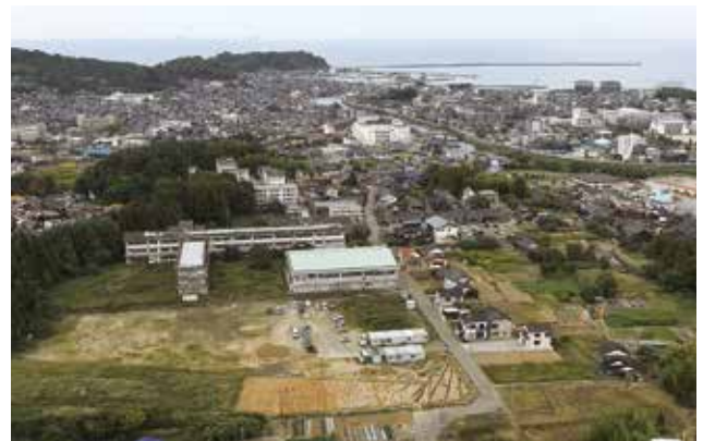
調査地の遠景（南から輪島港方向を望む）

今年度前半の調査区では、古代（7世紀末～9世紀前半頃）の掘立柱建物柱穴や塀とみられる柱穴列、土坑、井戸、溝などの遺構が数多くみつき、塀に囲まれた複数の大型掘立柱建物が整然と並んでいた様子が明らかとなりました。これら古代の掘立柱建物群は、付近に存在していたとされる鳳至郡衙（古代の役所）で郡司層を務めていた、郡領クラスの在地有力豪族の居宅である可能性があり、居宅の範囲は約半町（約55m）四方とみられます。調査地周辺は古代鳳至郡の中心となる地域の一つと考えられます。また、縄文土器や製作途中の石鏃・石斧などが出土しており、石器を製作していた縄文時代の集落跡も重複しています。