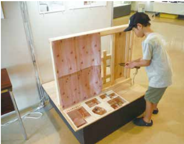
「クルル鉤」体験コーナーの様子