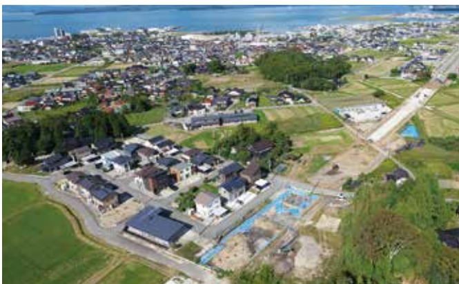
調査区遠景（南から）