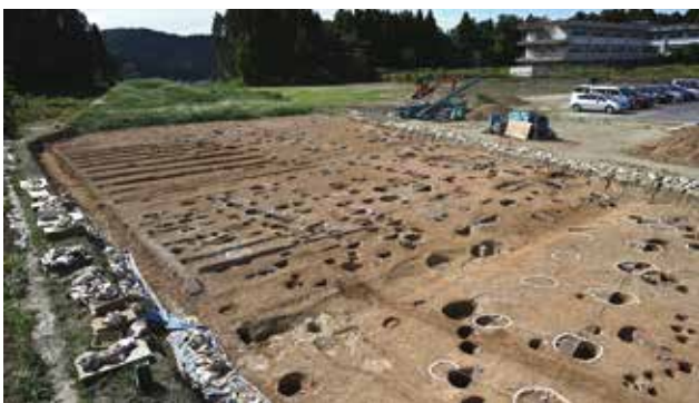
掘立柱建物群の全景（南東から）