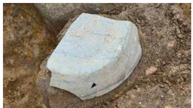
塀跡柱穴出土の須恵器杯