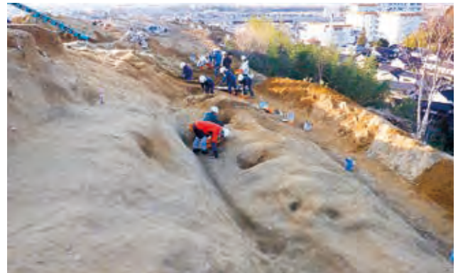
環濠の掘削作業（南東から）