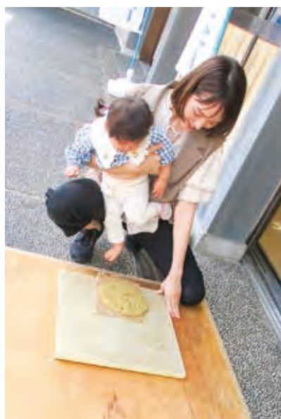
足で踏みつけてね