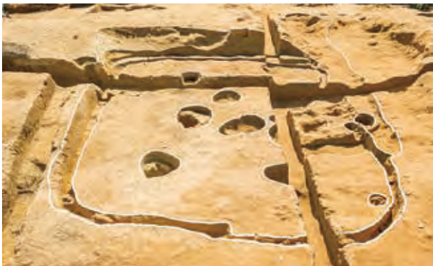
弥生時代後期の竪穴建物全景（北東から）