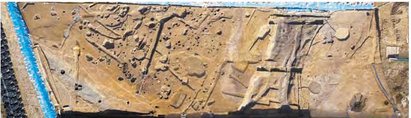
R・S 区の全景 (真上から俯瞰)