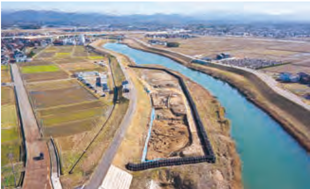
調査区域を梯川下流側から見る