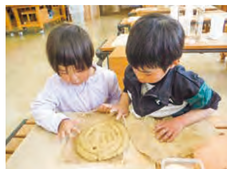
きれいに仕上げるぞ