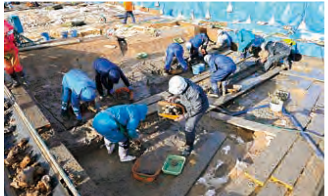
R・S 区 川跡 (NR06) の掘削