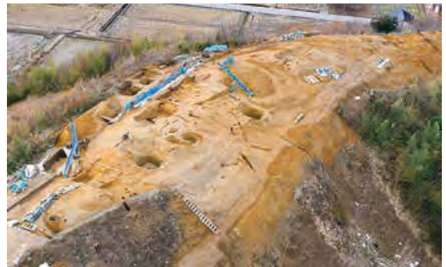
尾根上の大型土坑群（東から）