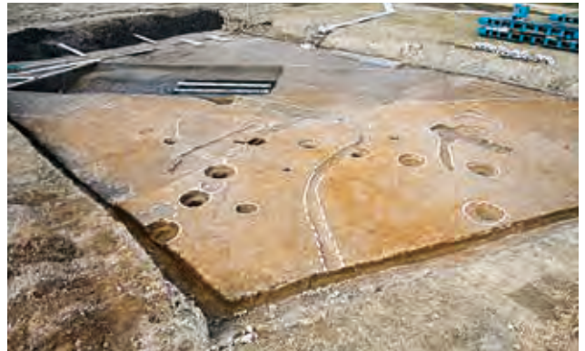
P 3 区 7世紀の掘立柱建物