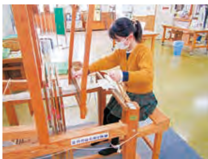
箒(おさ)を打ち込む様子