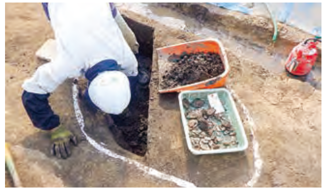
発掘調査風景（七尾市矢田遺跡）