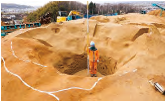
大型土坑全景（東から）