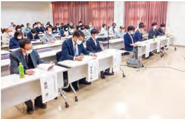
研究集会1日目 会場の様子

今回の研究集会は、古墳時代の水にかかわる祭祀に焦点を当て、北陸4県に加え、山陰、近畿、東海の研究者との共同研究として、令和3年度からの2カ年で実施しました。各地域での基礎研究を持ち寄り報告・討論する研究集会は、3年振りに対面形式での開催となりました。