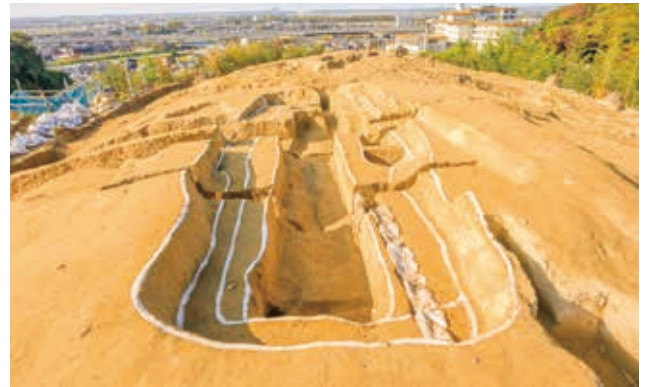
1号墓第1主体部 b の木棺痕（南東から）