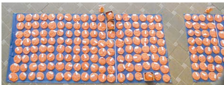
焼きあがった手形・足形