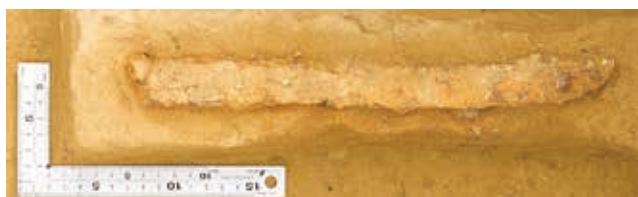
鉄製短刀（全長 30.6 cm）

観法寺墳墓群は、金沢市北部の森本丘陵西端に立地する遺跡です。2年間にわたる調査により、河北潟や森下川を望む舌状に張り出した尾根上に、溝で区画された弥生時代後期後半～終末期頃とみられる方形の墳丘墓が8基築造されていたことがわかりました。中でも1号墓は、四隅突出型墳丘墓という長方形の墳墓の四隅が張り出した、県内でも数少ない形の墳丘墓になる可能性があります。この地域の有力者が葬られていた墓とみられ、今後、他地域との関係や築造の背景などを詳しく調べていく必要があります。