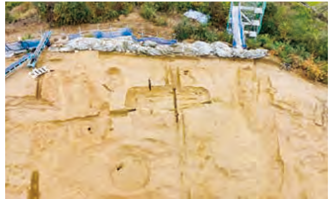
四隅突出型墳丘墓とみられる1号墓全景（北東から）

7号墓北側斜面で断面V字形の溝を確認しました。集落を囲むように掘られた環濠と呼ばれる堀状の溝の一部で、上幅約 6 m、深さ約 3.5 mの規模とみられます。溝下層からは弥生時代後期後半頃の土器が出土しました。