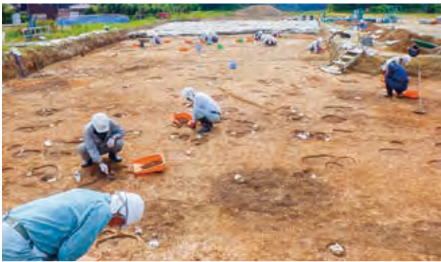
発掘調査風景（輪島市宅田上野山遺跡）

土器や木製品等の記名・分類・接合、実測・トレースのほか、発掘調査報告書の作成と刊行を行います。