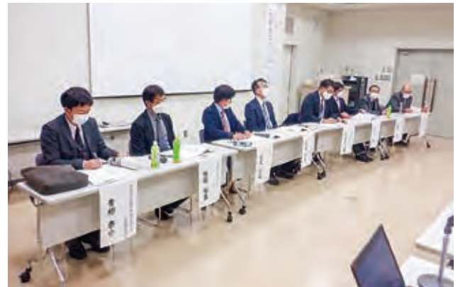
研究集会1日目 討論の様子

市八日市遺跡、小松市千代・能美遺跡、金沢市畝田遺跡、七尾市矢田遺跡出土の木製品を前に、わずか2時間半ほどの会でしたが、第一線で活躍される共同研究者の方々の遺物を観察する視点、高い見識に触れることができる貴重な時間となりました。