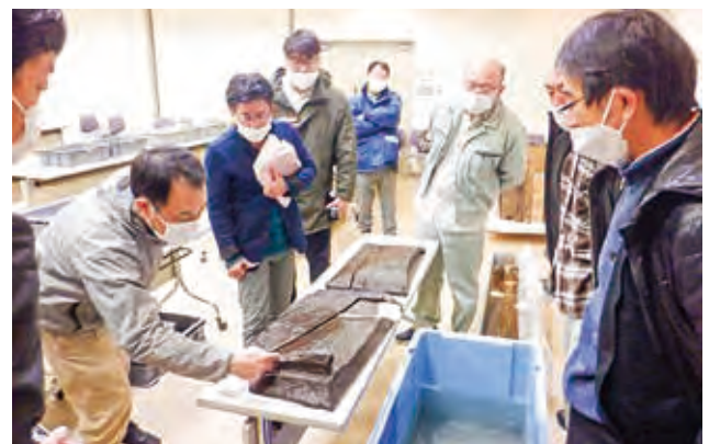
研究集会2日目 資料検討会の様子

市八日市遺跡、小松市千代・能美遺跡、金沢市畝田遺跡、七尾市矢田遺跡出土の木製品を前に、わずか2時間半ほどの会でしたが、第一線で活躍される共同研究者の方々の遺物を観察する視点、高い見識に触れることができる貴重な時間となりました。