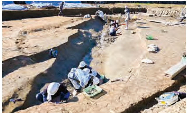
P 3 区 弥生時代環濠の掘削

R・S 区では、平安時代前期に埋積した 2 本の川跡がみつかり、これらが南から北に分流していたと思われます。2 本の川に挟まれた場所に弥生時代中期から古墳時代前期の生活跡がみつかりました。弥生時代中期の遺構は、管玉製作に関わる焼けた大きな穴や粘土を採掘したような大きな穴などがあり、弥生時代後期にも大きな穴がいくつもみつかりました。建物は検出できませんでしたが、平成 27 年度調査でみつかった遺構の広がりと考えられます。古墳時代前期には、竪穴建物や井戸跡などがみつかりました。このような成果を得て、平成 25 年度からの一連の現地調査を完了しました。