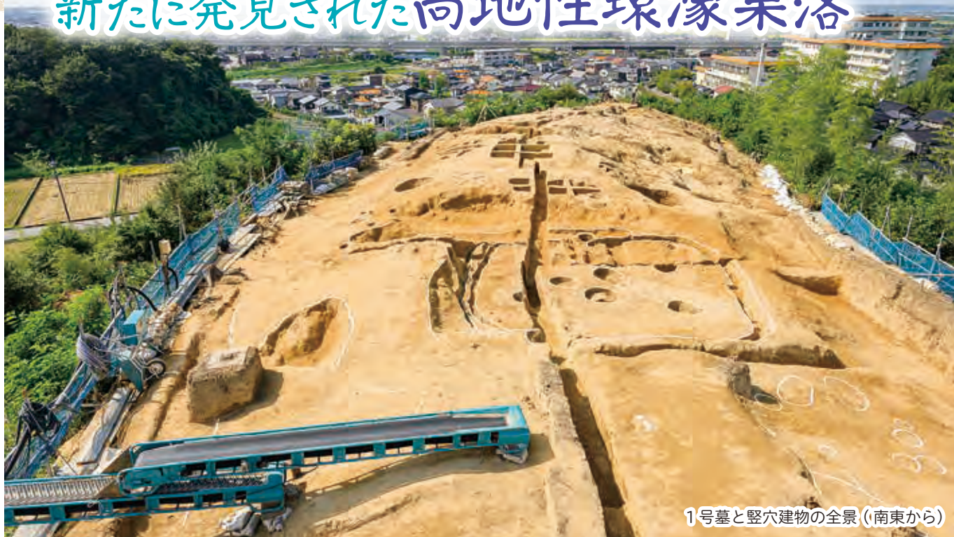
1号墓と竪穴建物の全景（南東から）