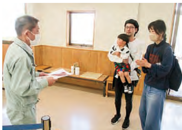
35万人目の記念品贈呈

なお、仕上がった作品は、乾燥後何回にも分けて焼成し、体験した皆さんへ返却を行いました。