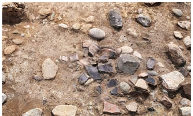
谷部 縄文土器出土状況（北から）