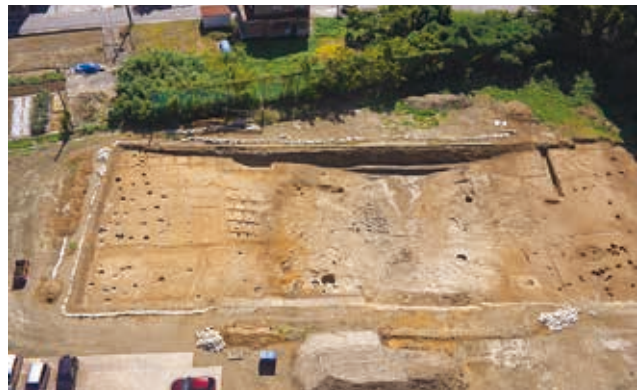
調査区全景（北から）