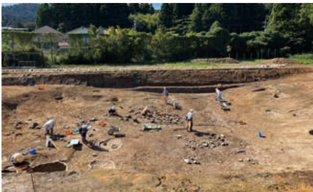
谷部 調査風景（北から）