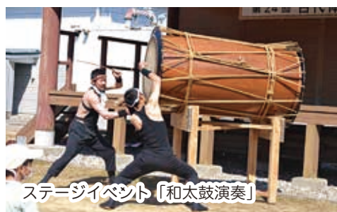
ステージイベント「和太鼓演奏」