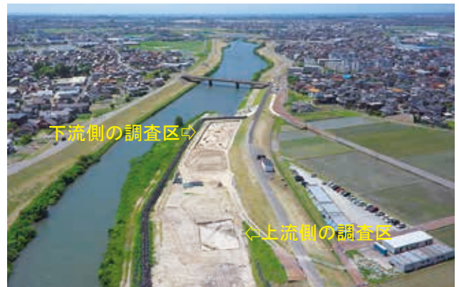
春期調査地の遠景（南東から海方向を望む）

各調査区からは、土器や陶磁器、管玉未成品・砥石・行火・石臼などの石製品、曲物やタモ網枠木などの木製品といった各時代の多彩な遺物が出土しました。