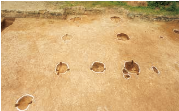
谷部西側 古代の掘立柱建物（北から）