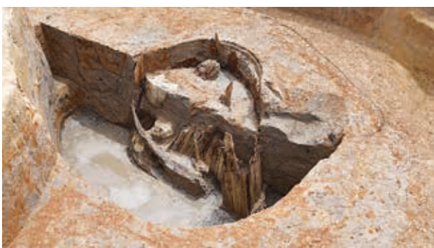
[調査区 2] 中世の井戸枠（北西から）