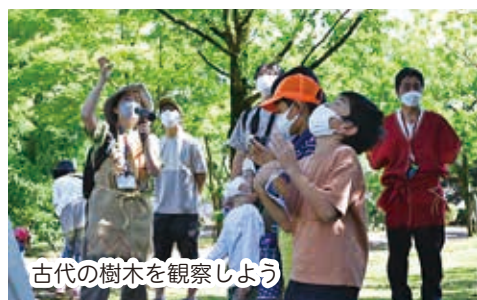
古代の樹木を観察しよう