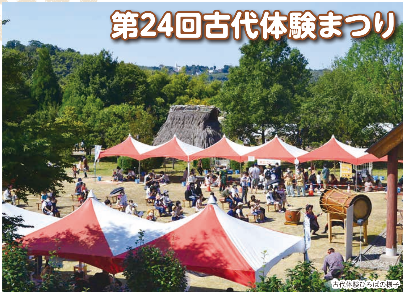
古代体験ひろばの様子