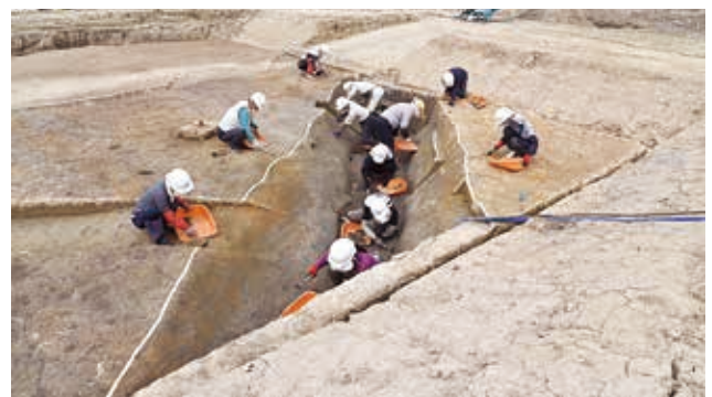
[調査区 1] 弥生時代の環濠掘削作業風景（南西から）