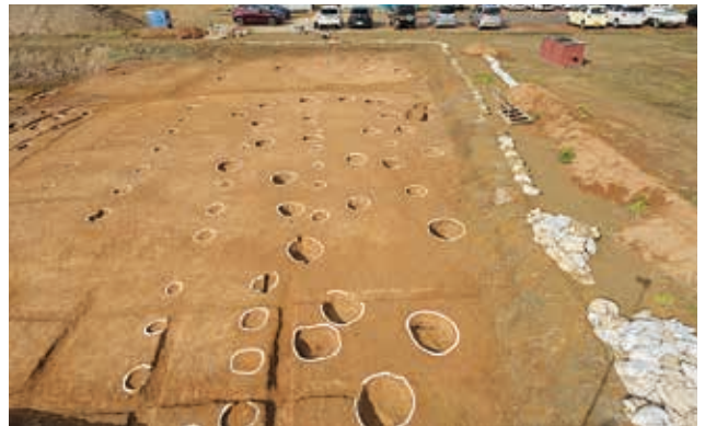
谷部東側 古代・近世建物群（南から）