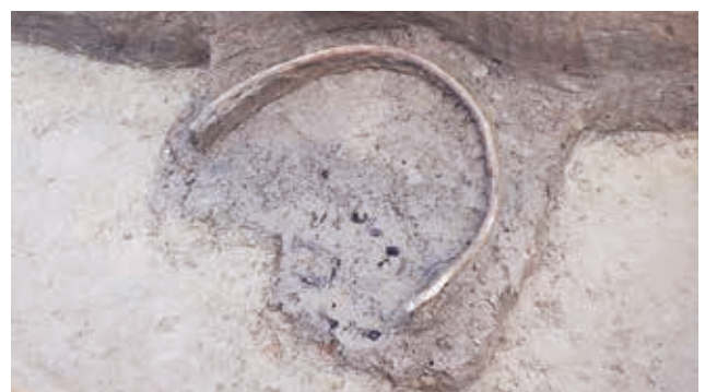
[調査区 3] 中世の木製品（タモ網枠木）（南東から）