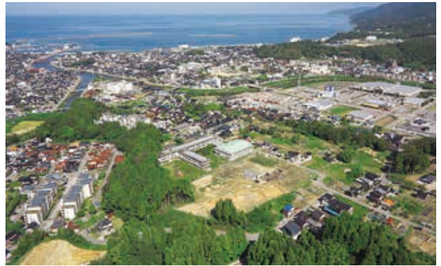
調査区の遠景（南から輪島港方向を望む）

谷部からは上層で 7～8 世紀の須恵器、下層で縄文後期から晩期の土器・石器が大量にみつかりました。谷部底面には粘土採掘坑とみられる土坑や磨製石斧などの石器を製作していた作業場もみつかりました。