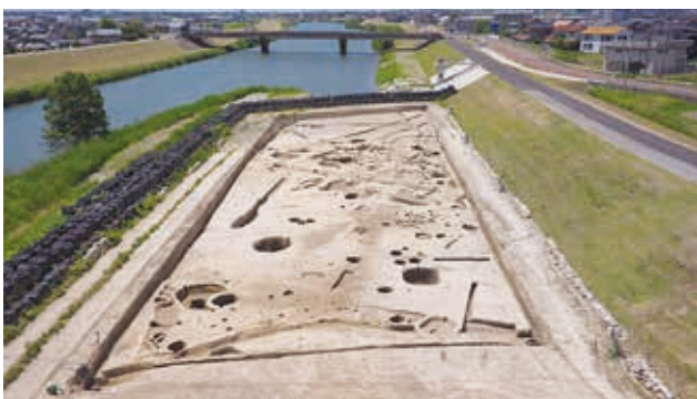
調査区 2・3 の全景（南東から）