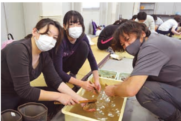
掘り出した土器を洗浄