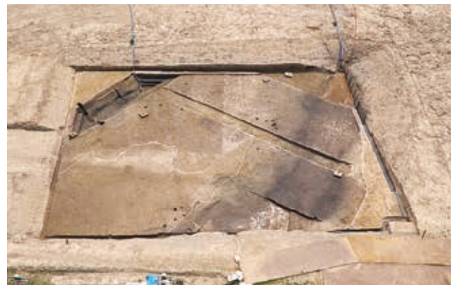
調査区 1 の全景（北東から）