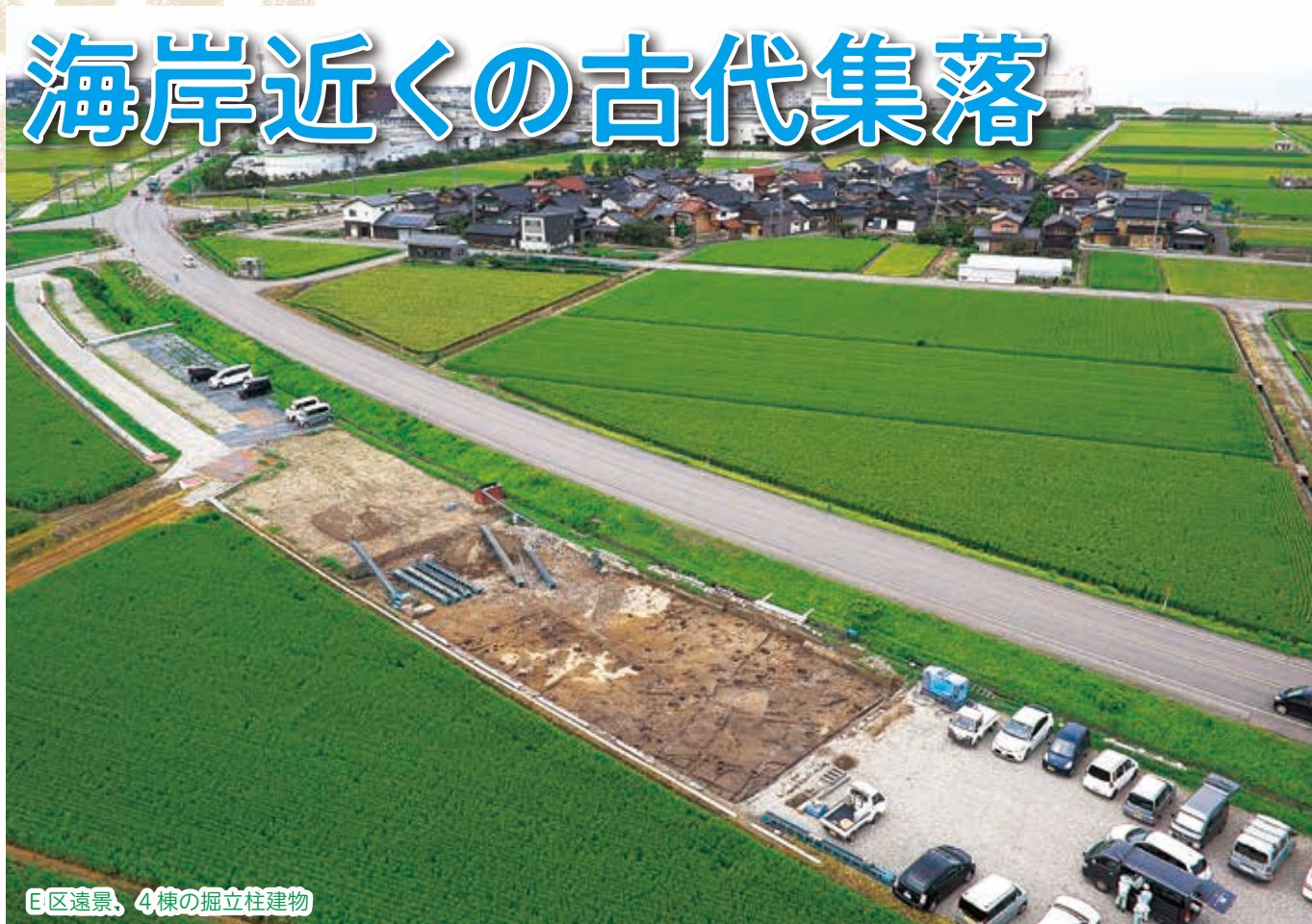
E区遠景、4棟の掘立柱建物