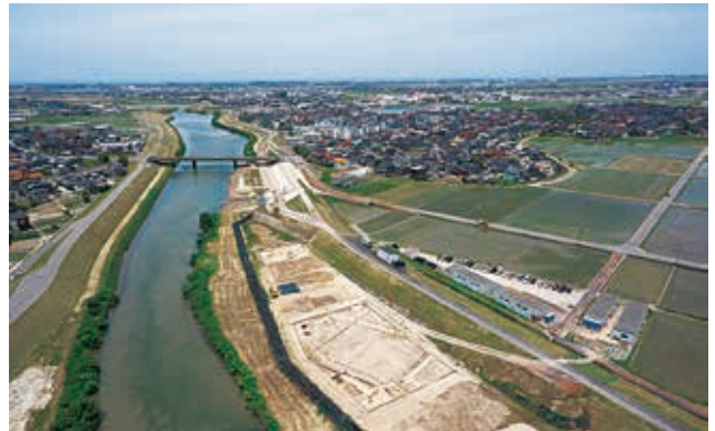
調査地の遠景（南東から）

調査区からは、中世の土器や陶磁器、石製品などのほか、井戸からは金メッキされた銅製の しょうはい 小坏や石臼、石塔、下駄、漆器椀、木製ひしゃくなどの遺物が出土しました。