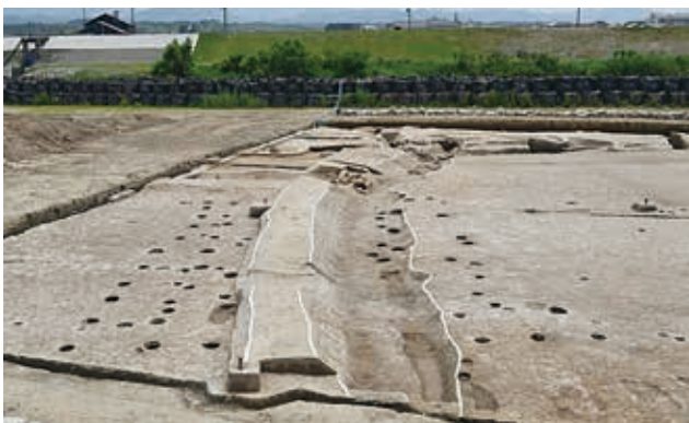
[調査区 2] 中世の水田畦畔と水路、柵列（北から）