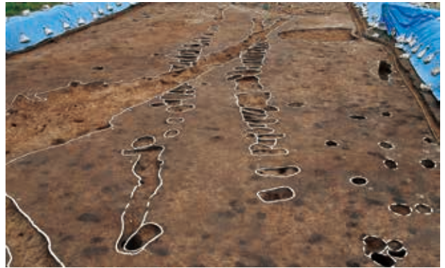
道路遺構 (古代・K4区・北から)

なお、このY2・3区を含む北側の一帯は、白鳳期 はくほう の古代寺院「津波倉廃寺」の推定地として知られる区域です。同区からは少量の古代瓦が出土しましたが、その遺構は確認できませんでした。寺院の位置を特定できなかったことは残念ですが、7年間の調査により、当地の弥生時代～中世の様相の解明に繋がる数多くの成果が得られました。