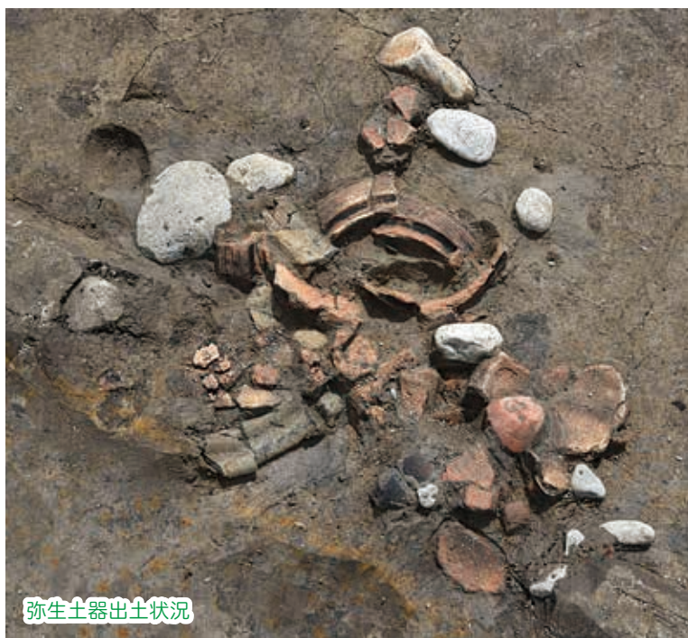
弥生土器出土状況

白山市小川 B 遺跡は、主要地方道金沢美川小松線の拡幅工事に伴って発掘調査を行いました。