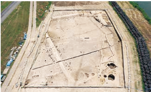
調査区 2 の全景（北西から）