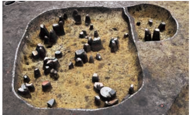
土器廃棄土坑 (平安時代・Y2区・北から)