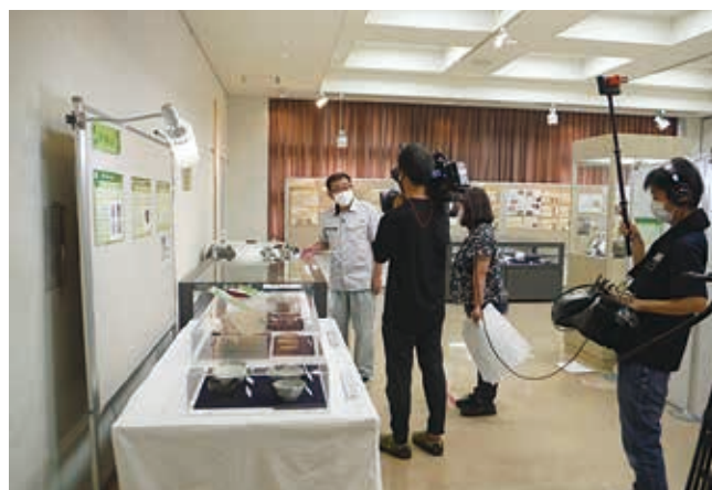
テレビ番組の取材風景