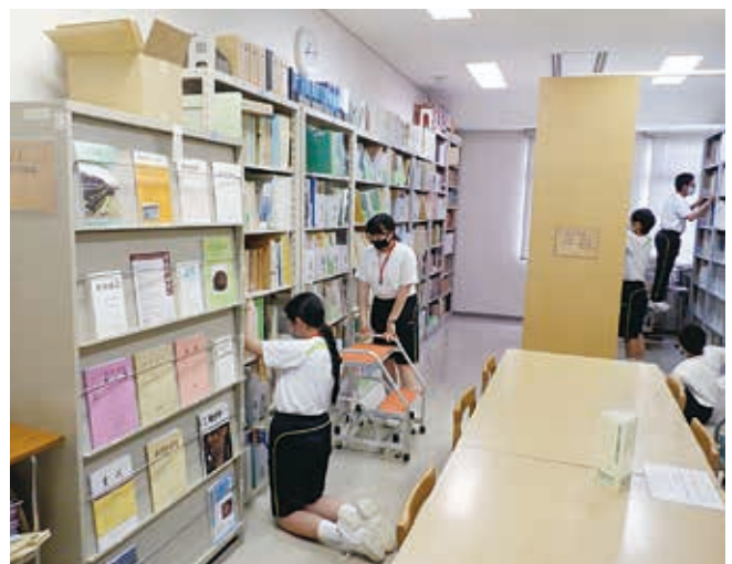
書庫の報告書を整理整頓