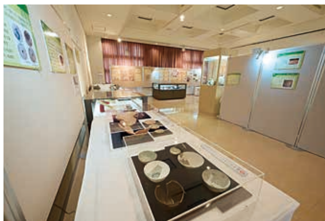
会場の様子（七尾城下コーナー）