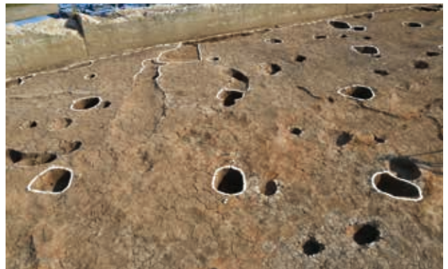
掘立柱建物 (平安時代・Y2区・北から)