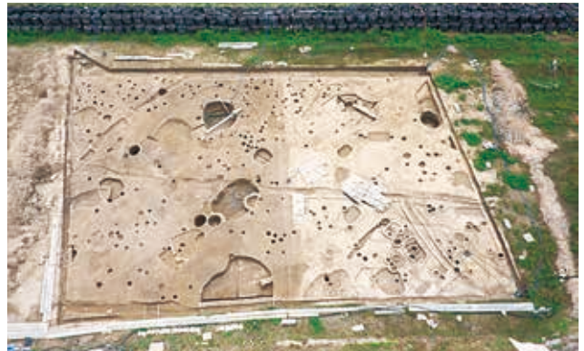
調査区 1 の全景（北東から）