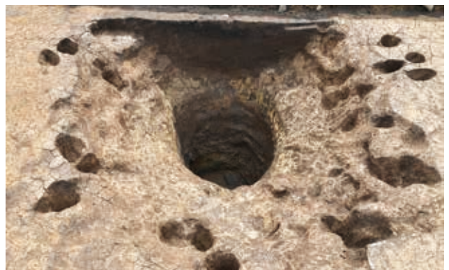
井戸 (平安時代・Y3区・北から)