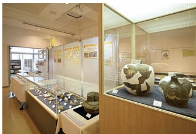
会場の様子（金沢城下コーナー）