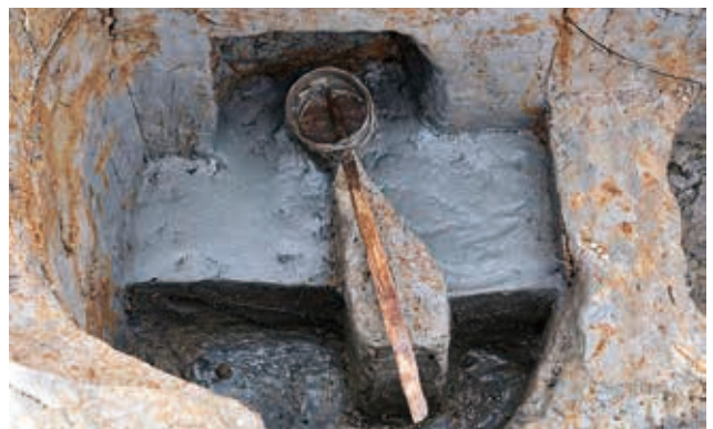
[調査区 2] 井戸出土の木製ひしゃく