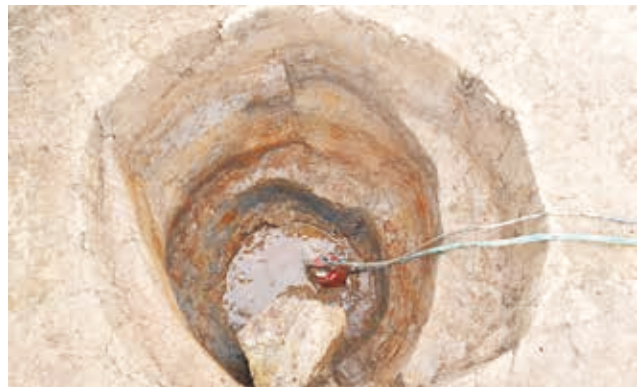
[調査区 1] 中世井戸の完掘状況（西から）