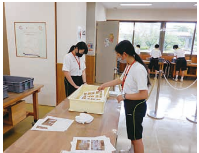
体験用具の準備中