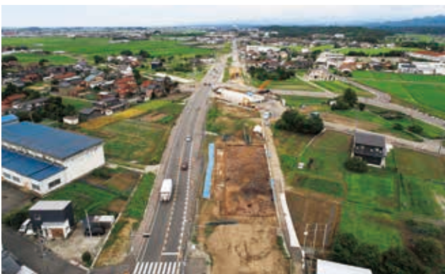
調査区遠景 (Y2区・西から)