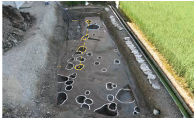
平安時代の建物と井戸 (3区)

以上より、弥生時代や平安時代の集落の広がり、南北方向の調査区外に伸びることを確認しました。