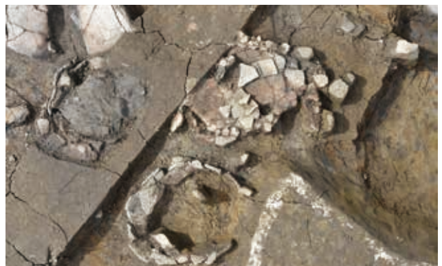
弥生土器出土状況 (4区)