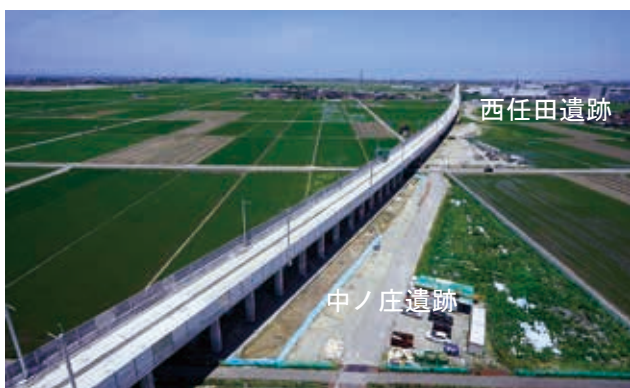
空から見た調査区（奥が金沢方向）