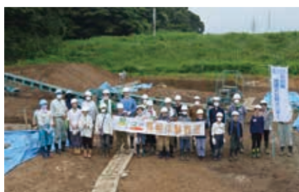
発掘終わって集合