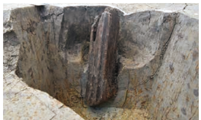
建物柱根（中ノ庄遺跡）