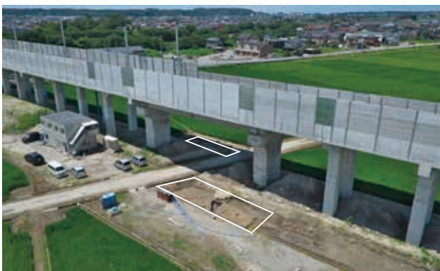
調査区全景 (白囲 奥:3区 前:4区)