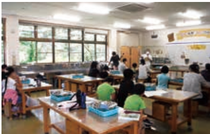
埋文センターのガイダンス