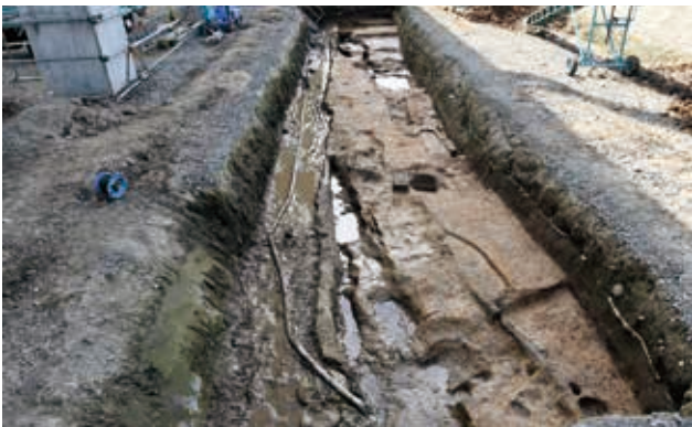
H 区完掘状況（北から）