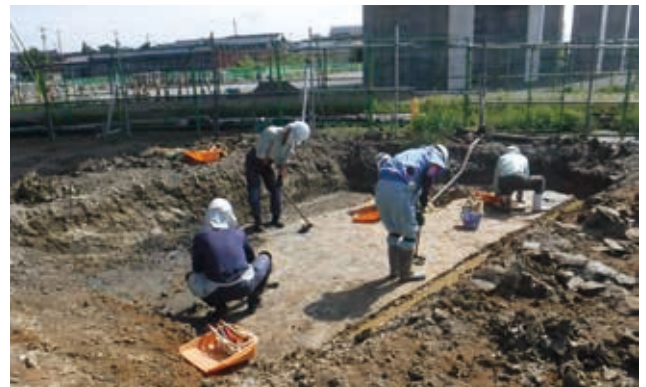
J 区作業の様子（北から）