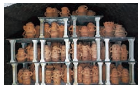
焼き上がった作品