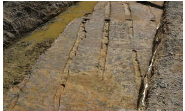
I 区畝溝完掘状況（北から）

前回の調査成果も踏まえると、H 区は区画溝で囲まれた中世の屋敷地、I 区は屋敷に接した耕作地であったと考えられます。