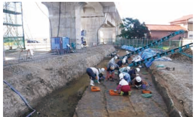
I 区作業の様子（北から）