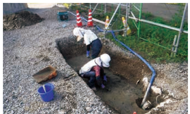
K 区作業の様子（南東から）