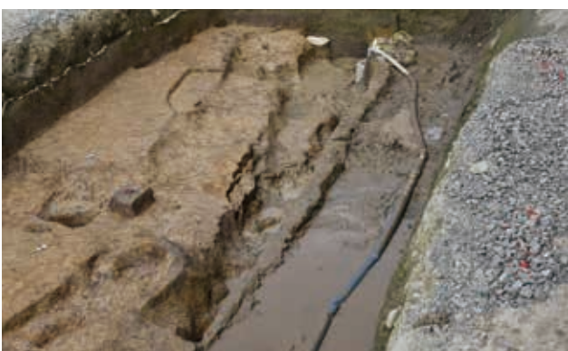
H 区区画溝完掘状況（南から）