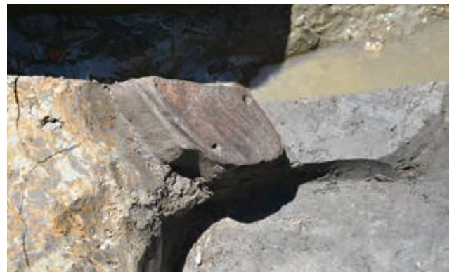
井戸から出土した下駄（西任田遺跡）

以上より、古代末～中世初めにおける両遺跡はよく似た様相が見られ、となりあう集落が同じような様相であったと思われます。