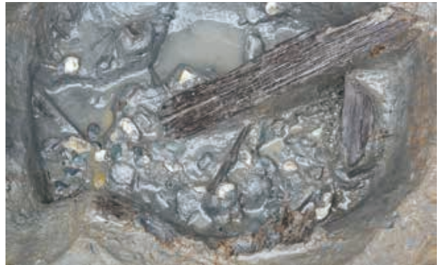
井戸の底面付近 (3区)