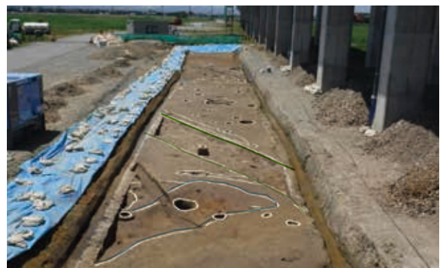
弥生時代の溝（前）と古代の区画溝（奥）（中ノ庄遺跡）