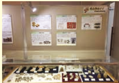
不思議な形・不思議なもの