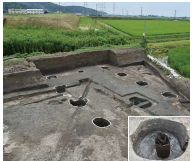
掘立柱建物跡（北から）