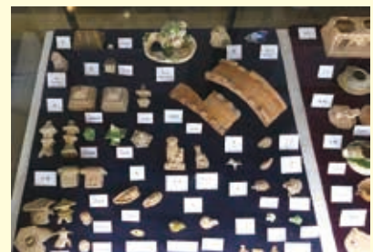
江戸時代のミニチュア製品