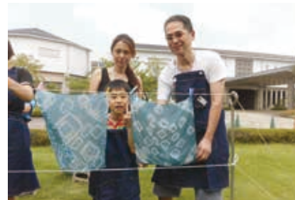
作品の出来上がり