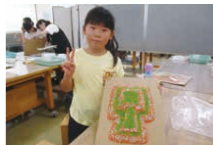
作品の出来上がり