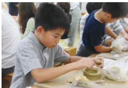
粘土の輪積み成形

7月14日(日)の「ミニ縄文土器づくり」では、円盤の底に粘土紐を積み上げ、内面をナデ、外面に縄文などを施して完成です。午前と午後に分かれた48名の体験者は、波状に整えた口縁、施文具による文様を付けることで、ミニとはいえ立派な縄文土器を仕上げました。