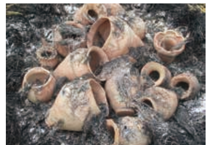
焼きあがった弥生土器