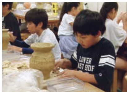
弥生土器の文様付け