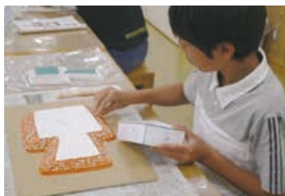
墳丘斜面を葺石で固めます