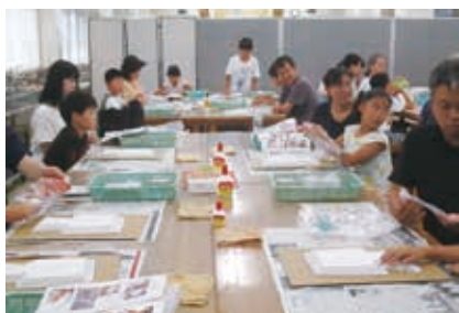
パーツのパネルを重ねる

夏休み後半の8月25日(日)に能登を代表する王墓である「中能登町雨の宮1号墳」をモデルとして、「古墳模型づくり」を開催しました。ガイダンスの後、古墳のパーツであるパネルを積み重ね、斜面に粘土を塗り込んで成形です。午前20名、午後28名の体験者は、粘土に小石をはめ込んで葺石を表現しながら、古墳の形状と構築技術を知る機会となりました。