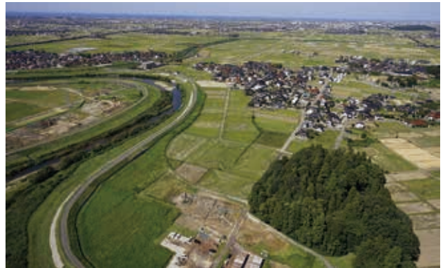
調査地の空中写真（南東から）

遺物は加賀焼や越前焼、中世土師器皿とともに多くの焼けた切石なども出土しました。また、包含層などから下層に相当する平安時代末の遺物が大量に出土しており、その時期に非常に活発な活動があったと考えられます。遺物の中には、古代の瓦や緑・灰釉陶器、古代末の白磁なども多く含まれることから、国府との関連も想起され、残る下層の調査に期待が膨らみます。