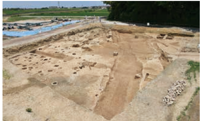
東側の調査区完掘状況（南東から）