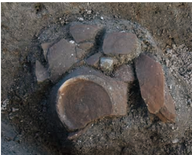
土師器琿の出土状況