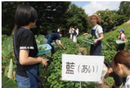
体験農園で藍の摘み取り

8月4日(日)の講座では、藍の成長の遅れを心配しましたが、予想を超える生葉を確保することができました。午前26名、午後23名の体験者は、まず、絹の布に割り箸や豆などを使い、模様を考えながら輪ゴムで絞りました。次に、藍の生葉を絞った染液を作り、そこに酢を加えて浸すこと約10分。最後に、輪ゴムを外して水洗いをすると模様があらわれ、広場に干して出来上がりです。作品を手にした参加者からは、「また、来年もしたい」との声も聞かれました。