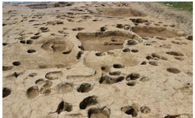
西側の調査区完掘状況（東から）