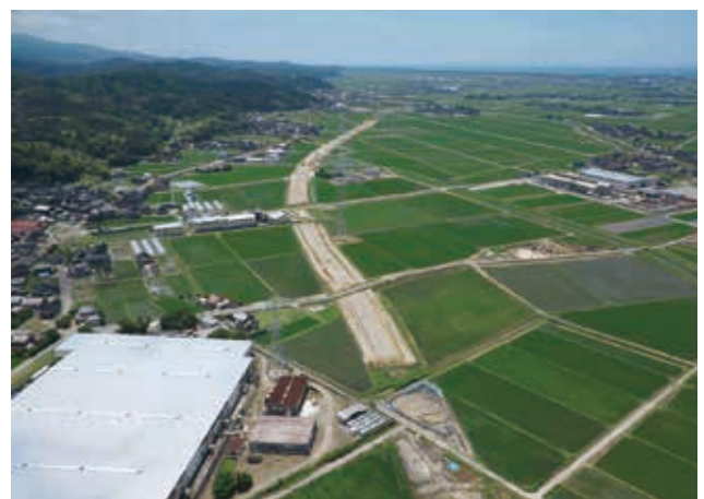
道路予定地と調査区の空中写真（北から）