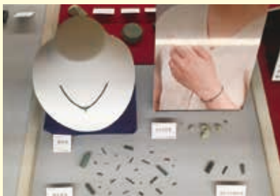
玉のコーナー (八日市地方遺跡の出土品)