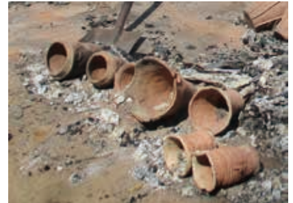
焼きあがった縄文土器