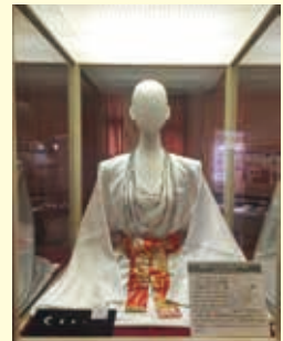
玉のコーナー (管玉の首飾り)