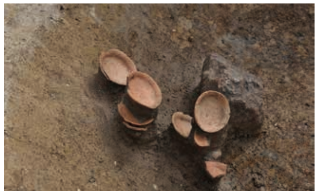
中世土師器皿出土状況（北から）