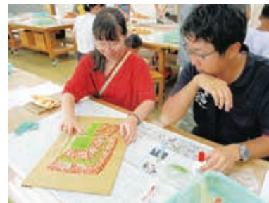
いよいよ完成まじか