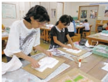
ていねいに重ねていきます

中能登町雨の宮1号墳の模型です。階段のようになった斜面に、縄文アクセサリーでおなじみの粘土を貼り付け、粘土の上に葺石(ふきいし)区画を作りながら小砂利(こじり)を敷きます。古墳の周囲は自由に家(か)でつくって自分だけの古墳に。