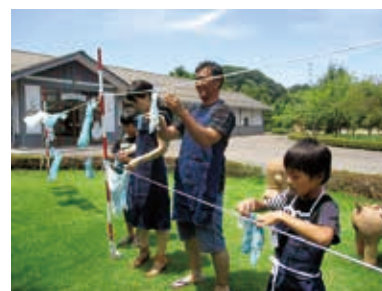
天日に干して気持ちいいね