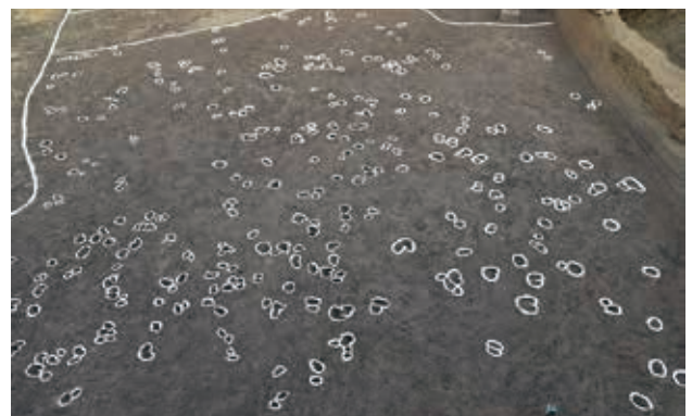
古代以降の水田でみつけた牛の足跡