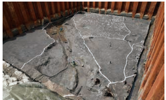
弥生時代後期の水路