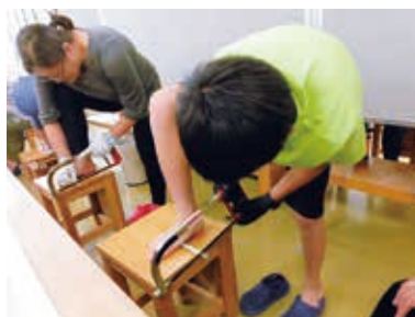
湯口を切り落とすよ

低融点合金(ていゆうてんごうきん)で作る鑄造体験(ちゆうぞうたいけん)ですが、体験は、鑄(い)バリを取り去り、磨(みが)く体験です。だんだんピカピカになる様子に、わくわくしながらの時間を過ごしました。