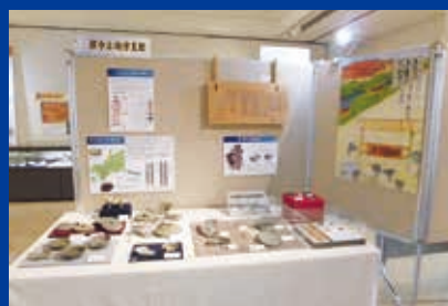
奈良・平安時代の展示