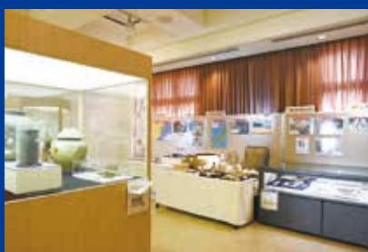
鎌倉・室町時代の展示