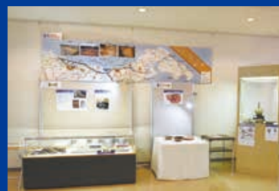
古代北陸道のルート図