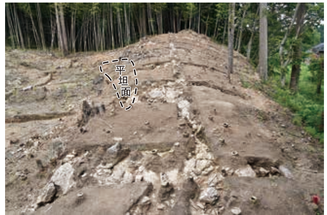
尾根部調査状況（南西から）