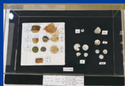
江戸時代のミニチュア製品