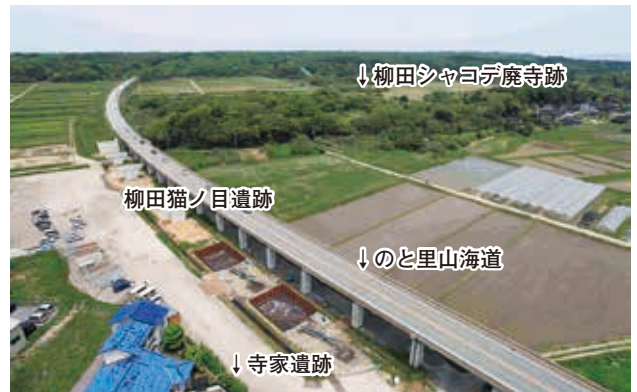
調査地の遠景（南西から） （寺家遺跡方向から柳田シャコデ廃寺跡方向へ）

また、最下層の落込みから、縄文時代前期の土器や石器がまとまって出土したことから、調査区は、寺家遺跡の下層に存在する縄文集落の縁辺部にあたると考えられます。