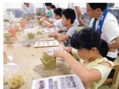
小さくてもしっかりと波状に