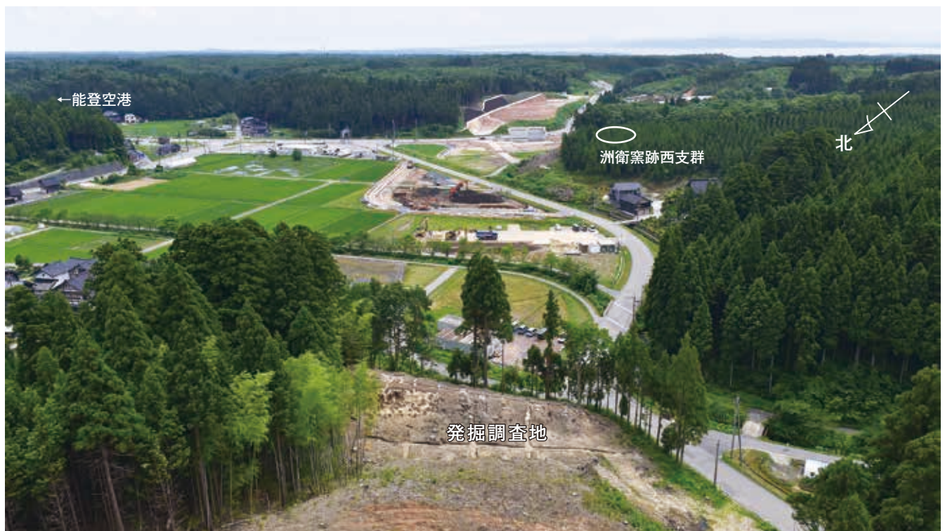
調査地周辺のようす（北西から）