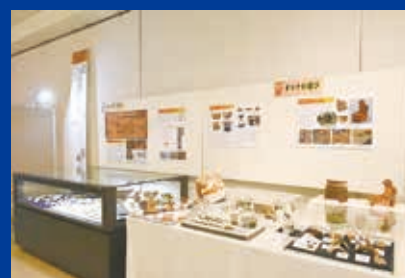
安土・桃山時代から江戸時代の展示