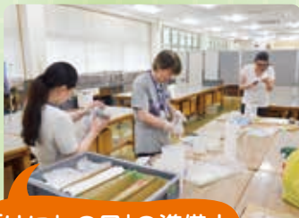
「はにわの日」の準備中