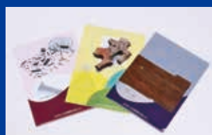
20 周年記念クリアファイル