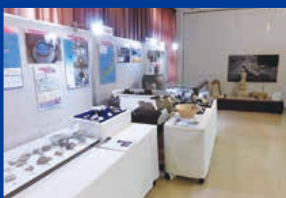
鎌倉・室町時代の展示 (奥に石造物)