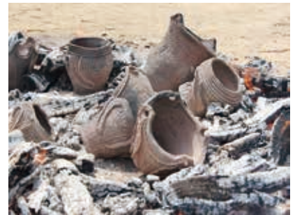
焼きあがった縄文土器