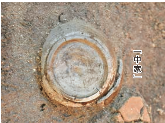
古代の墨書土器「中家」