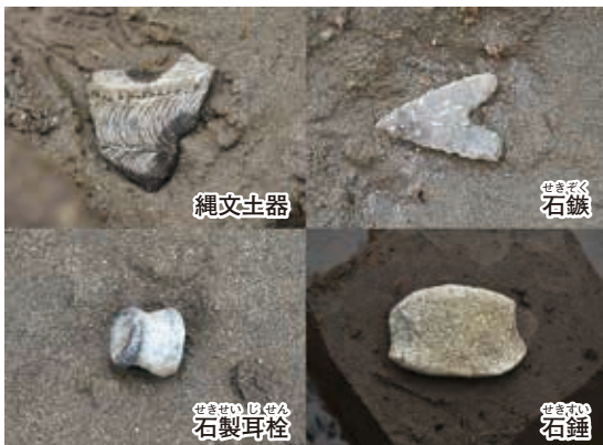
縄文時代前期の土器や石器