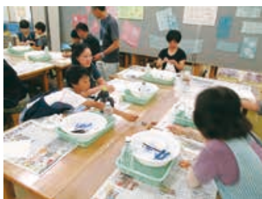
いよいよ絞りの作業

『藍の生葉染め』 7月22日(日)に行いました。夏の酷暑によって藍の成長が悪く心配しましたが、なんとか生葉を確保できました。まずは、絞(しぼ)りです。豆や石、割り箸などを使って、模様を考えながらの作業です。藍の葉を絞ってドロドロの液を作り、そこに浸すこと約10分。広場に干して、できあがり。