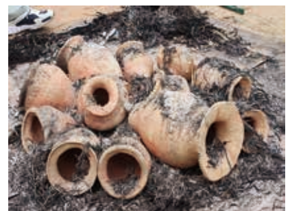
焼きあがった弥生土器