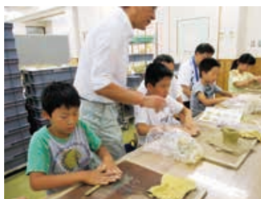
まずは、粘土ひもづくりから

通常の講座の半分の粘土で縄文土器を作りました。波状の口縁(はじょうこうえん)としたり、縄文を表面につけたり、小さくても立派な縄文土器になりました。