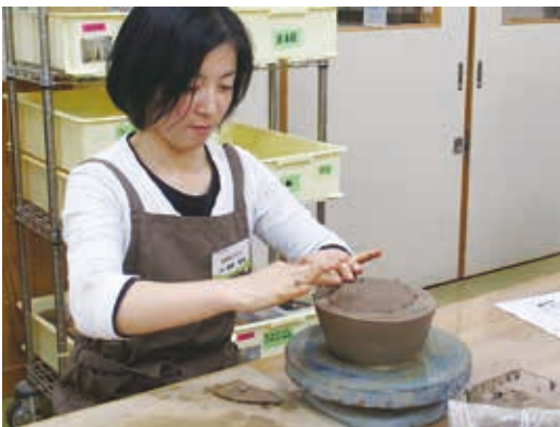
風船技法で長頸瓶の胴部を成形