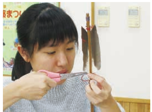
矢羽根の接着に集中

午後は、鹿の角を加工したアクセサリーづくりです。鹿の角を割れないように削り、表面に古代のデザインを刻み完成です。ふだんは体験できない黒曜石を使った矢と鹿の角のアクセサリーを手に、満足のいく一日となりました。