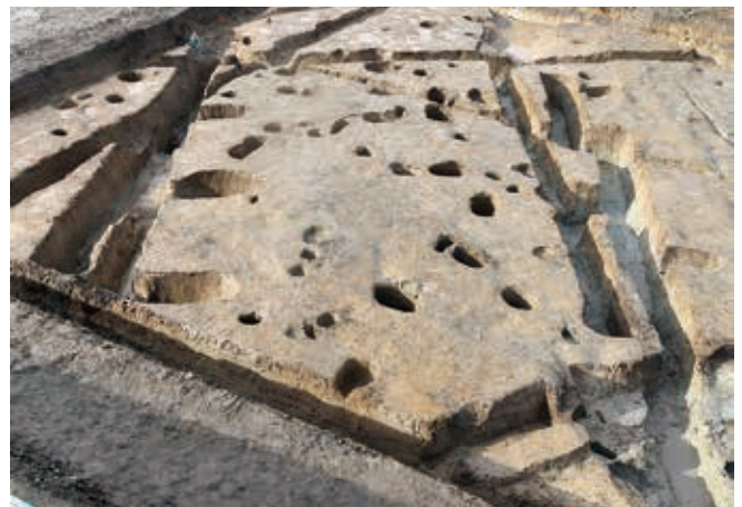
ぬのぼり 布掘建物

鑄の羽口や鑄型の一部とみられる鑄造関連遺物です。 湯口ばりは、鑄型の注ぎ口で固まった銅塊で、国内初出土です。