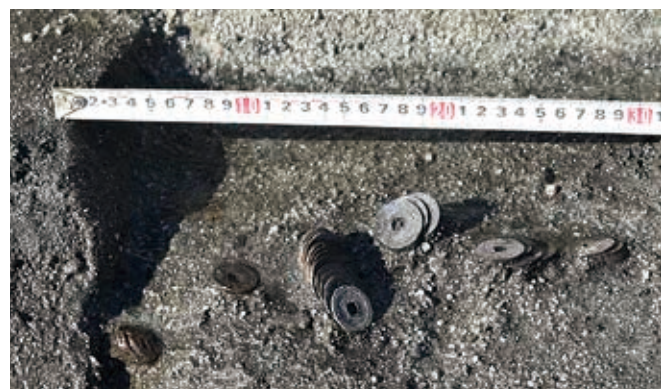
水田からみつけた銅銭