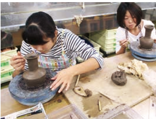
長細い頸をつけて完成