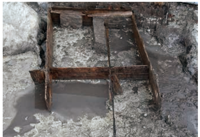
川跡内の板組み遺構

等間隔に2本の柱に支えられる板塀(写真中央)です。 国内では検出例の少ない、貴重な調査事例となりました。