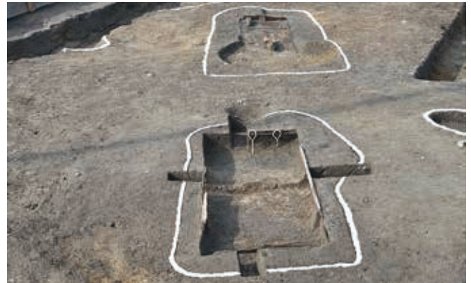
木棺が納められた墓