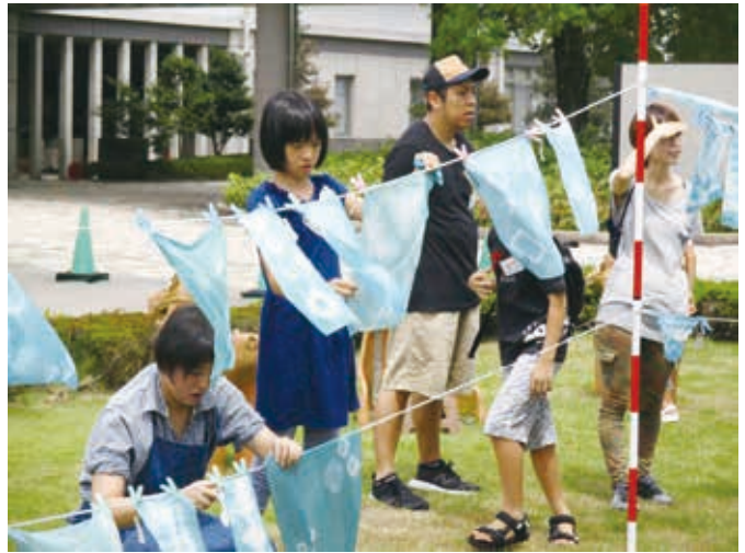
風にたなびく藍のハンカチ

午後は、生の葉を、布の上にきれいに配置してラップし、上からハンマーで叩く、叩き染めです。一斉に叩くので、工房内に響く「ガンガン」という大音量。工房に来られた方は、さぞびっくりされたことでしょう。