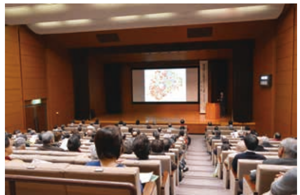
会場は後ろに立ち見の方も・・・