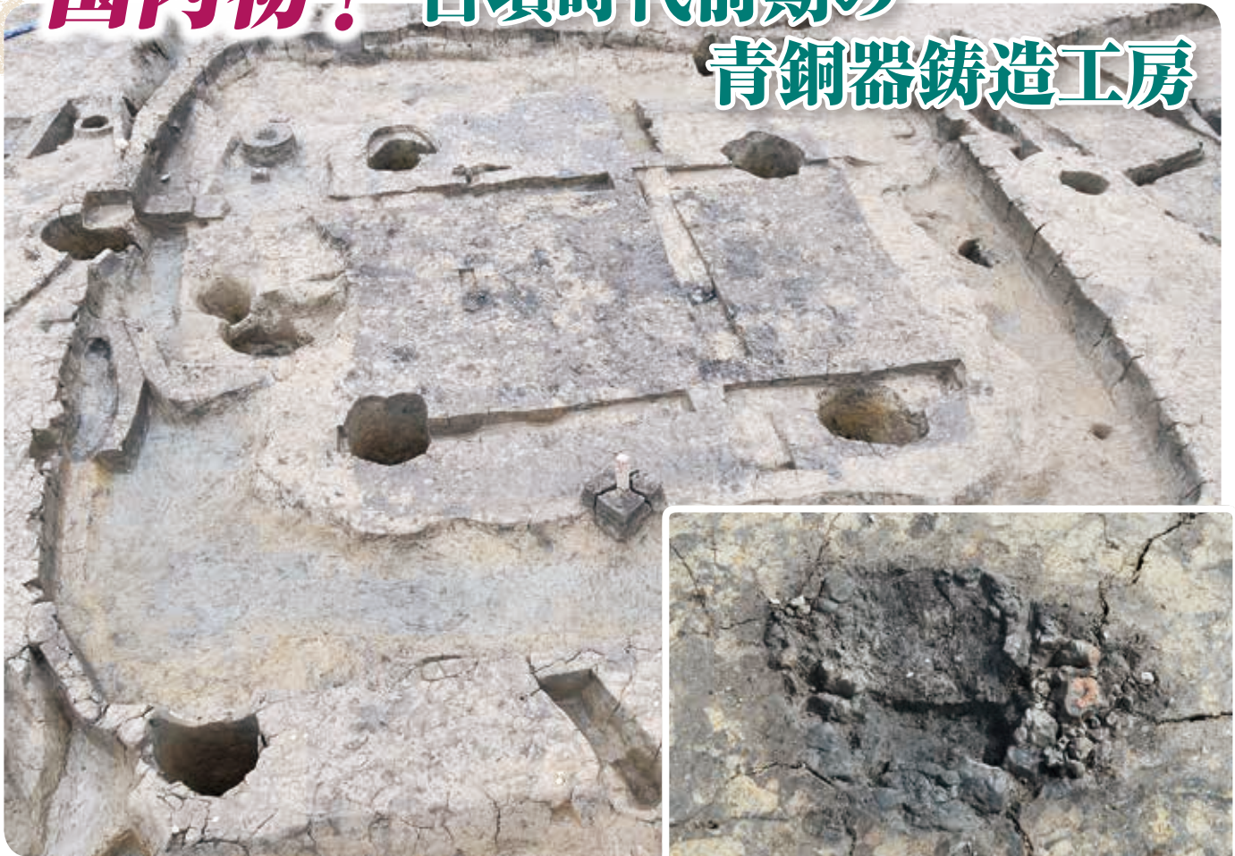
7基の炉跡が確認された4号竪穴