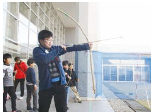
つくった矢で試し射ち