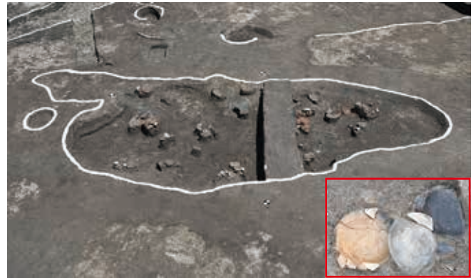
土器が廃棄された土坑（右下は一部拡大）

調査区北側は、奈良・平安時代の掘立柱建物の柱穴などに、洪水による砂礫が入り、上層で検出された中世の水田も洪水砂で覆われるなど、水による災害を受けやすい場所であったことがわかります。