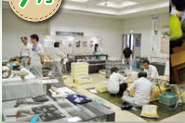
「いしかわの発掘展」準備中