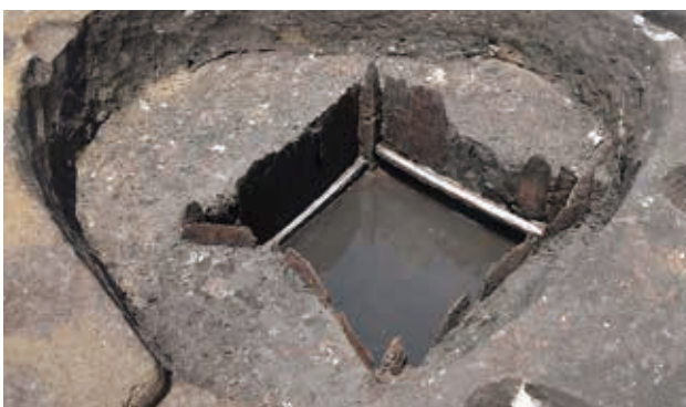
縦板組の井戸（中世）