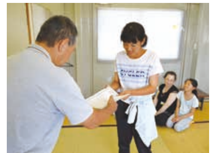
「こども考古学者認定証」の授与