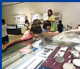
古墳からの出土品を見る子どもたち