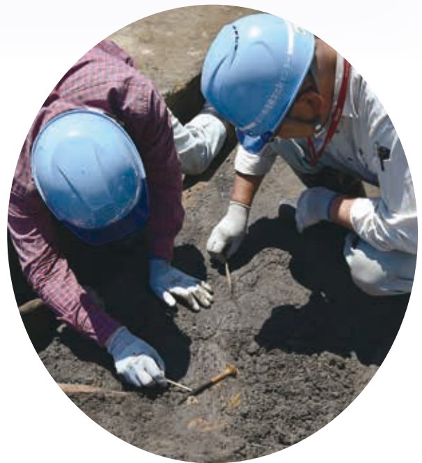
調査員もビックリ!の発見でした

この鉋は、大陸からもたらされたもので、鉄器が列島各地に普及していく過程を考えると、とても重要な資料となります。