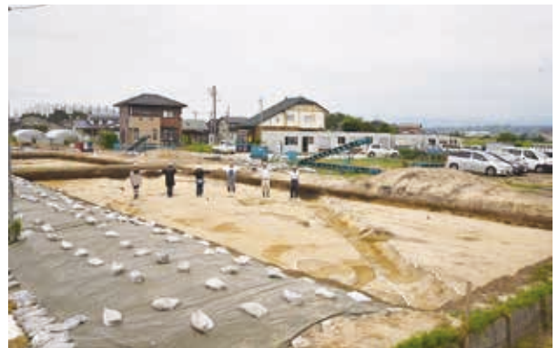
古代の道路遺構（南西から）