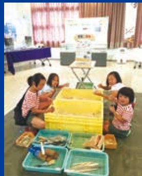
発掘体験コーナー