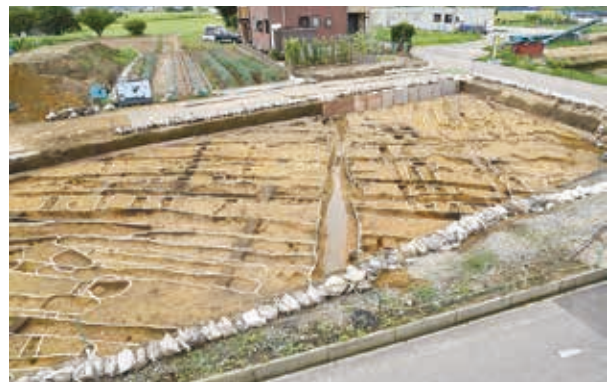
古代～中世の畝溝と水路（北西から）