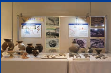
古墳時代の展示 （畝田・寺中遺跡、千代・能美遺跡）