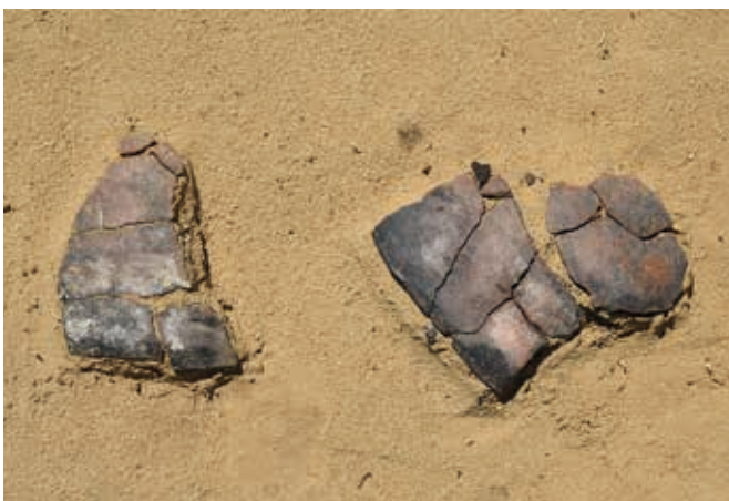
砂層から出土した縄文土器（縄文時代後期）