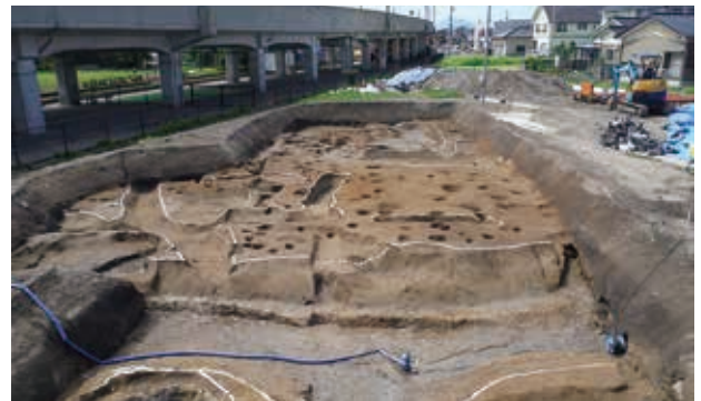
環濠南側の方形周溝墓群（弥生時代中期）

中世の主な遺構は ほったてぼしらたてもの 掘立柱建物、井戸などです。井戸は たていた 縦板を井戸枠とし、井戸底の水溜に みづため まげもの 曲物を据えるものが多くみつかっています。