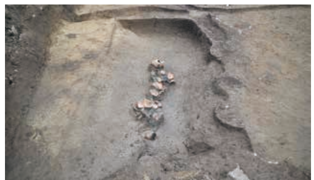
環濠に捨てられた土器（弥生時代中期）