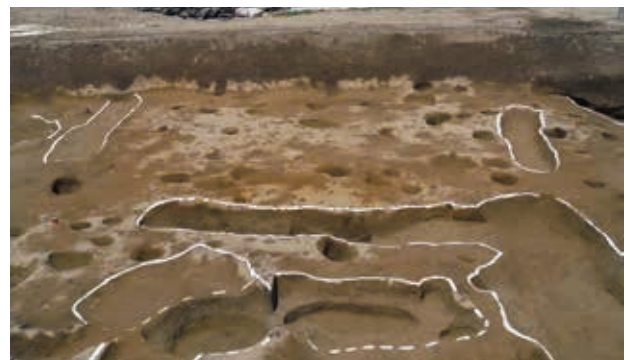
方形周溝墓（弥生時代中期）