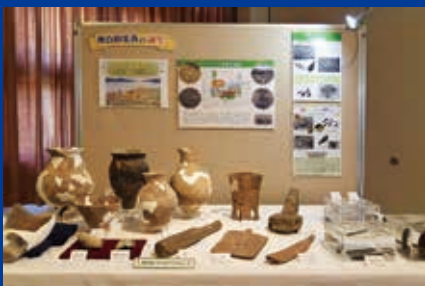
弥生時代の展示（八日市地方遺跡）