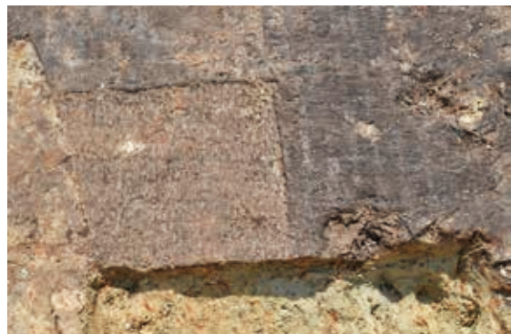
穴に敷かれていた編物のアップ（江戸時代前半）