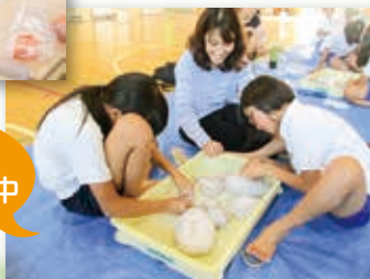
親子で まが玉製作中