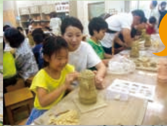
「人物はにわ」を作ろう