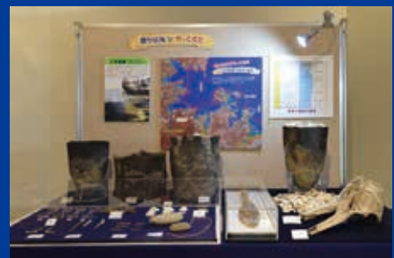
縄文時代の展示（三引遺跡）