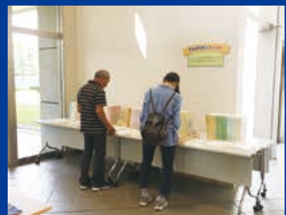
発掘報告書の展示コーナー