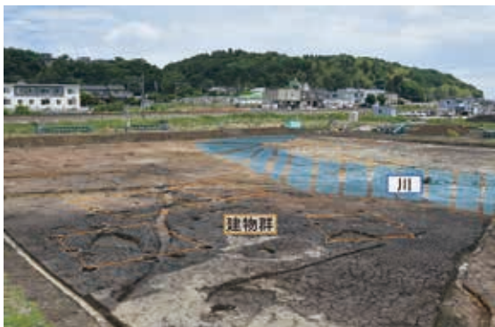
川と掘立柱建物群