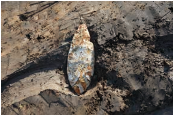
槍先形尖頭器（旧石器時代末）

今回の調査では集落内を流れる川の周囲で暮らす人々の様子が明らかとなりました。調査地の小字名 こあざ である「コショウズワリ」について、現在伝わる表記は「小姓生割」という地割の名残ですが、湧水などを表す「生水 しょうず 」との関連も想定でき、水と関わりの深い土地であったことが調査結果からもうかがえます。