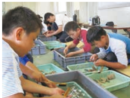
出土品の洗浄体験