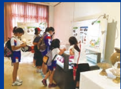
見学の子どもたち