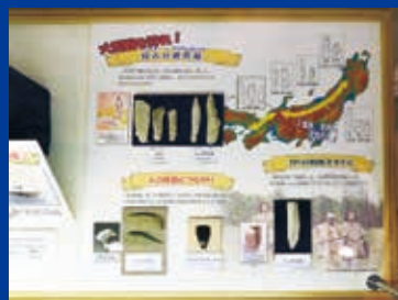
旧石器時代の展示