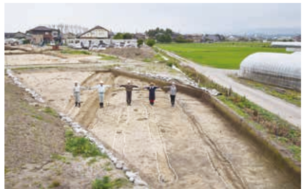
中世の道路遺構（南西から）