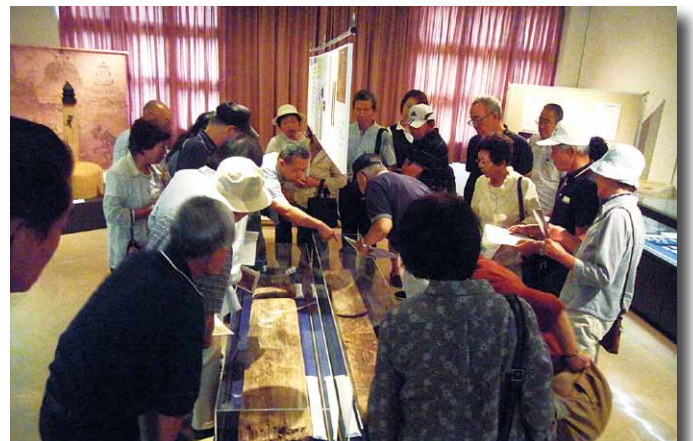
珠洲市直公民館のみなさん

珠洲市野々江本江寺遺跡出土の木製板碑と木製笠塔婆は、出土資料としては日本最古のもので、墓標の始まりを考える上で貴重な資料です。また能美市宮竹墓谷中世墓群出土の宝塔・五輪塔などの石塔類や、数珠玉・蔵骨器・六道銭など墓に納められる品々も展示しました。野々江本江寺遺跡の地元である珠洲市直の皆さんを始め多くの方々に、初公開となる資料などを見ていただくことができました。