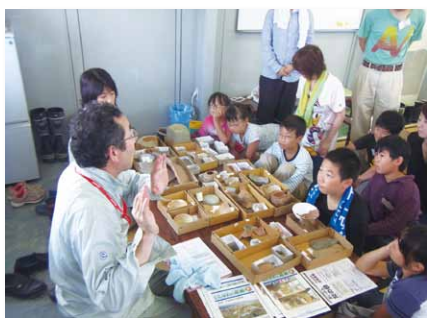
出土品の展示解説