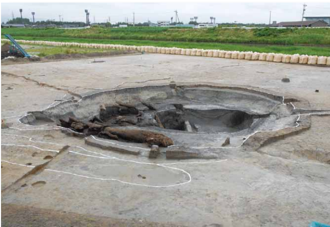
「大規模な凹み」 (北から)