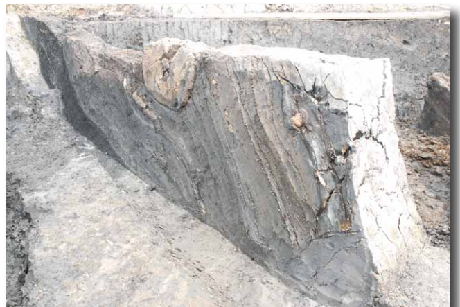
「大規模な凹み」の堆積土 (西から)