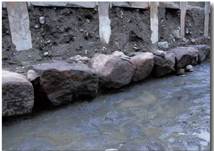
戸室石の石列(第2面)