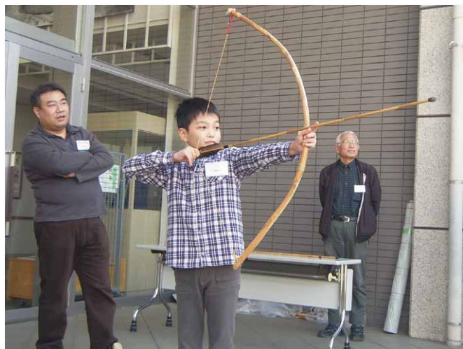
的をねらって試射