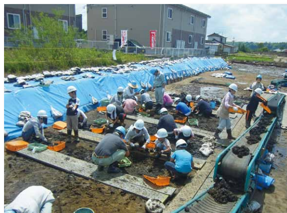
七尾市古府ヒノバンデニバン遺跡

また、2回とも参加者からは調査員に鋭い質問が数多く寄せられました。また、発掘した遺構、出土した土器などを参加者はデジカメで撮影しました。最後は「埋レポート」として体験してわかったことをまとめ、自分だけの報告書を作成しました。