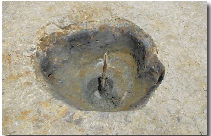
中央に竹管を据付けた井戸 (南西から)