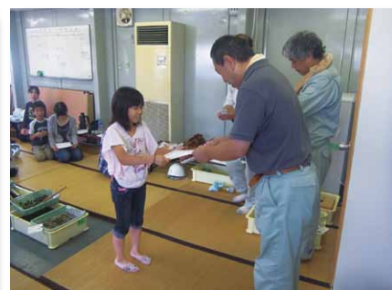
「こども考古学者」認定証の授与