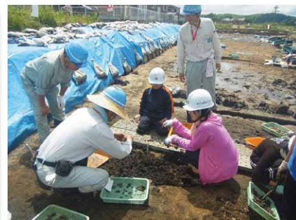
大発見?! 調査員が土器を解説