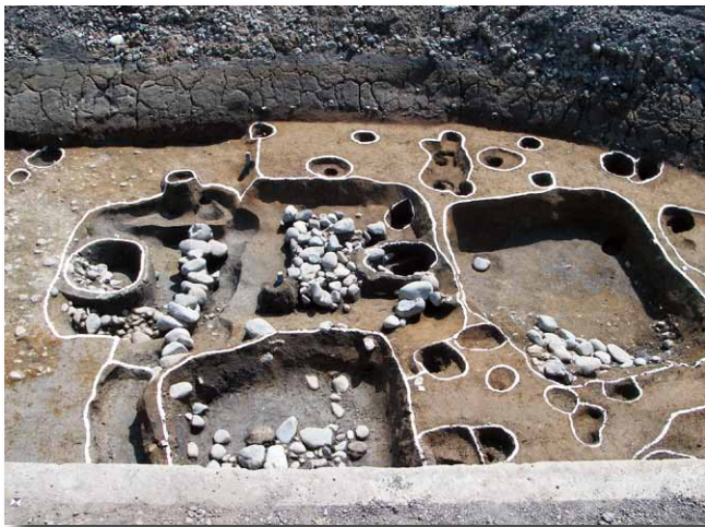
密集する竪穴状遺構