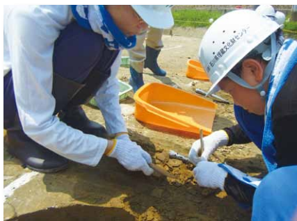
竹ペラを使って慎重に