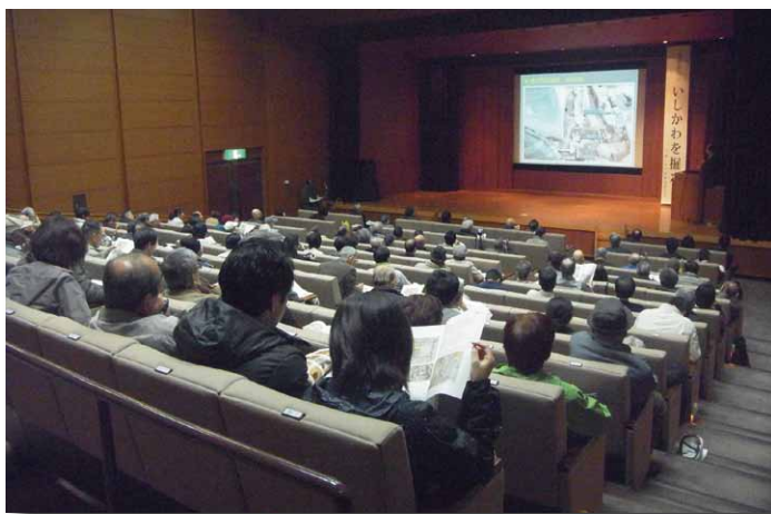
報告会場のようす

参加された 180 名からは、報告に関する質問を受けた後、「発掘の状況が知りたかった」・「埋文に興味がある」などの動機やご意見をアンケート結果としていただきました。