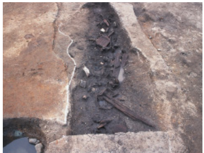
土器・木製品出土状況