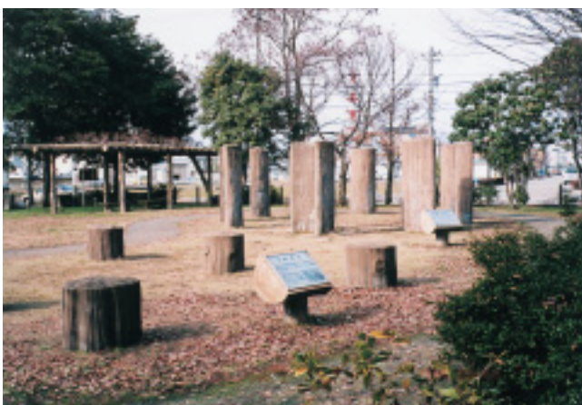
復元された環状木柱列