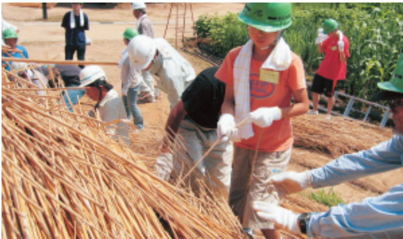
茅束を一つずつ垂木 たるき に縛っていきます。(第2回講座)