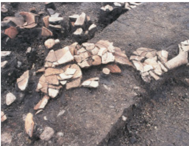
弥生土器出土状況