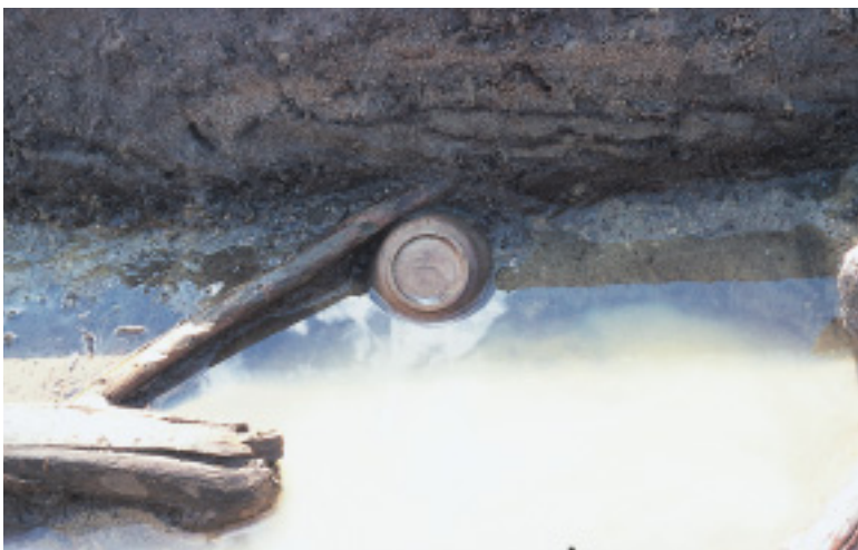
墨書土器出土状況

森ガッコウ遺跡はかほく市森地内、森集落から北に200m程離れた水田中に広がっています。遺跡の北東側の水田部には鉢伏浄水場遺跡、南側には森城跡が、また南東側の丘陵上には、国指定史跡の縄文遺跡、上山田貝塚があり、その他周辺域にも多数の遺跡が分布しています。