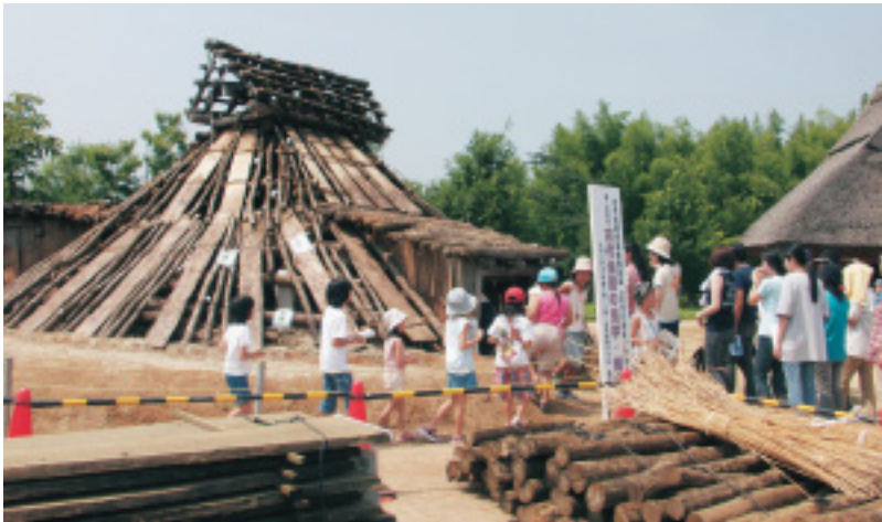
土と茅を取り除き、木組みの状態で見学・解説会。(第1回講座)

平成17年8月に行われた講座の様子を紹介します。土葺き屋根は雨水がたまりやすく、建物内部の湿気がこもりがちです。そのため、下地の茅や屋根部材もはやく傷みます。講座ではどのように傷んでいるかを見学し、茅葺き職人やセンター職員の指導により、茅下地の取り付け作業の体験を行いました。また、奈良時代の復元住居等では茅がいたんできたすき間を埋める差し茅作業や斧の使用体験も行いました。