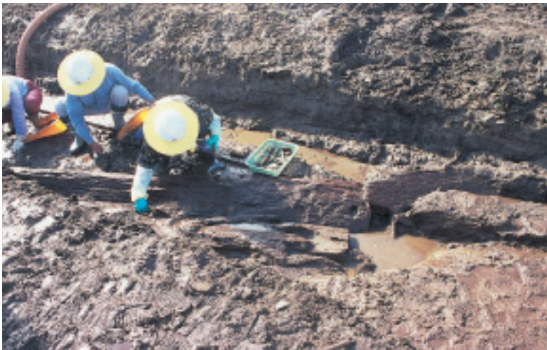
板で護岸された水路