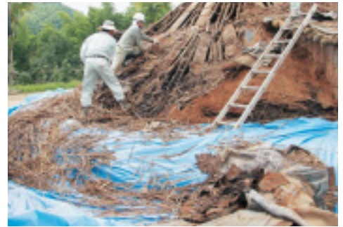
屋根の土を除けた後、古くなった茅の下地を取り除いています。