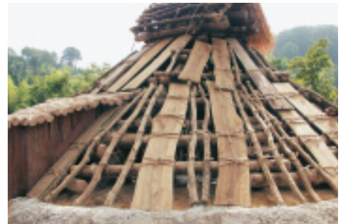
腐朽した入口、母屋、垂木等の部材を交換し取り付けました。