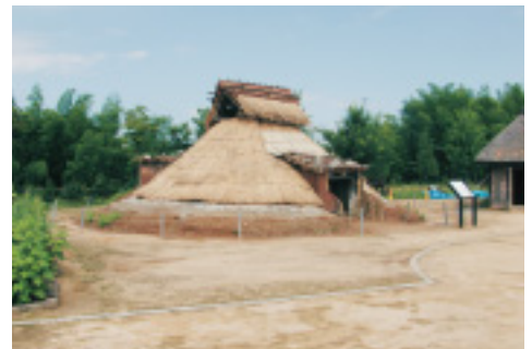
下層は横葺き、上層は縦葺き、厚さ合計約20cmの茅下地が完成。