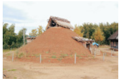
厚さ約30cmの土をかぶせて完了。