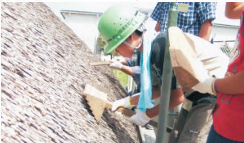
すき間をヘラで起こし、茅を詰める差し茅作業。(第2回講座)